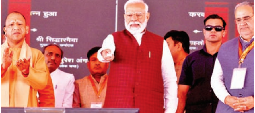
वाराणसी में कई रेल परियोजनाओं का उद्घाटन करते प्रधानमंत्री नरेन्द्र मोदी व उप के सीएम योगी।

बीजिंग। चीन के राष्ट्रपति शी जिन्पिंग ने पाकिस्तान के साथ द्विपक्षीय संबंधों के बढ़ते रणनीतिक महत्व को रेखांकित करते हुये कहा है कि वह नवनिर्वाचित राष्ट्रपति आसिफ अली जरदारी के साथ काम करने को तैयार हैं। जियो-न्यूज ने बताया कि चीन के राष्ट्रपति ने पाकिस्तान पीपल्स पार्टी (पीपीपी) के दिग्गज नेता को राष्ट्रपति के रूप में दूसरा कार्यकाल हासिल करने पर बधाई देते हुए कहा कि (चीन) विभिन्न क्षेत्रों में (पाकिस्तान के साथ) सहयोग को आगे बढ़ाने के लिए (निर्वाचित राष्ट्रपति) जरदारी के साथ काम करने के लिए तैयार है। उन्होंने आपसी हित के मामलों पर दोनों देशों द्वारा प्रदर्शित द्विपक्षीय समर्थन को याद करते हुए, दोनों देशों के बीच रणनीतिक संबंधों के बढ़ते महत्व पर प्रकाश डाला। उन्होंने कहा कि दोनों देशों ने सीपीईसी की स्थापना के जरिए सार्थक परिणाम हासिल किए हैं।