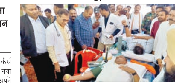
रक्तदान करते मंत्री बन्ना गुप्ता।

जमशेदपुर। टाटा मोटर्स वर्कर्स यूनियन ने रक्तदान का नया कीर्तिमान बनाते हुए अपने शिविर में 2324 यूनिट रक्तदान कराने में सफलता हासिल की है। स्वास्थ्य मंत्री बना गुप्ता टाटा मोटर्स वर्कर्स यूनियन द्वारा जमशेदजी टाटा के 185वीं जन्मदिन के अवसर पर गत रविवार को आयोजित रक्तदान शिविर में रक्तदान कर उनको श्रद्धांजलि अर्पित की। इस