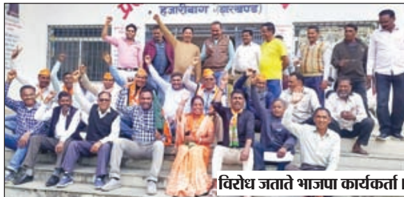
विरोध जतते भाजपा कार्यकर्ता।