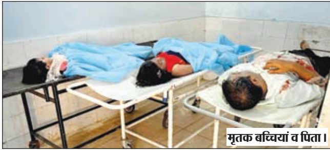
मृतक बच्चियां व पिता।