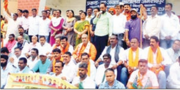
जमशेदपुर प्रखंड कार्यालय पर घटना कार्यक्रम को संबोधित करते सांसद विद्युतवरण महतो।

जमशेदपुर। झारखंड की झामुमो कांग्रेस और राजद गठबंधन सरकार में व्याप्त भ्रष्टाचार, जेएसएससी प्रश्न पत्र लीक एवं नियुक्ति घोटाला, वादाखिलाफी, अराजकता, तुष्टिकरण, महिला उत्पीड़न, ध्वस्त विधि व्यवस्था और खनिज संपदाओं की खुली लूट, बिगड़ी स्वास्थ्य व्यवस्था जैसे मुद्दों को लेकर सूबे की मुख्य विपक्षी दल भाजपा राज्य की गठबंधन सरकार के खिलाफ लगातार हमलावर है। सोमवार को भाजपा