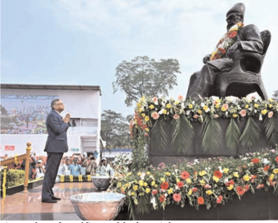
संस्थापक को टाटा स्टील वर्क्स में नमन करते चेयरमैन एन. चंद्रशेखरन।

आज जमशेदपुर में आयोजित कार्यक्रम में टाटा संस के चेयरमैन एन चंद्रशेखरन और टाटा स्टील के सीईओ और प्रबंध निदेशक टीवी नरेंद्रन उपस्थित थे। इस अवसर पर कंपनी के अन्य वरिष्ठ अधिकारी और यूनियन के सदस्य भी उपस्थित थे। कार्यक्रम की शुरुआत वर्क्स मेन गेट पर चेयरमैन, सीईओ और एमडी, यूनियन पदाधिकारियों, समूह कंपनी के अधिकारियों, कंपनी के कर्मचारियों और जमशेदपुर के नागरिकों द्वारा संस्थापक को श्रद्धांजलि देने के साथ हुई। बिस्नुपुर पोस्टल पार्क में जमशेदपुर के नागरिकों को संबोधित करते हुए, एन चंद्रशेखरन ने कहा, हमारे संस्थापक, जमशेदजी टाटा ने एक ऐसे भविष्य की कल्पना की थी जहां उद्योग सकारात्मक बदलाव के लिए एक बड़ी ताकत होगा, और यह बहुत गर्व की बात है कि हम उनकी विरासत को बरकरार रख रहे हैं। इस अवसर पर, हम अखंडता, नवाचार और सामाजिक जिम्मेदारी के सिद्धांतों के प्रति अपनी प्रतिबद्धता की पुष्टि करते हैं जिन्होंने हमारी स्थापना के बाद से हमारा मार्गदर्शन किया है। हम जमशेदपुर और इसके निवासियों के लिए एक उज्ज्वल, अधिक समृद्ध भविष्य बनाने के लिए