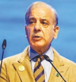
जरदारी के नाना जुल्फिकार अली भुट्टो के बलिदानों को हमेशा याद रखेंगे। जब शहबाज शरीफ ने बोला न शुरू किया, तो पीटीआई समर्थित सदस्यों ने चोर के नारे लगाने शुरू कर दिये।

नवनिर्वाचित पीएम शहबाज ने कहा कि इस संसद में ऐसे प्रतिभाशाली लोग बैठें हैं, जो पाकिस्तान की नैया पार लगा सकते हैं। इनमें पत्रकार, बुद्धिजीवी, नेता, धार्मिक नेता शामिल हैं। उन्होंने कहा कि पाकिस्तान के सामने एक बड़ी चुनौती और अवसर था। उन्होंने कहा, अगर हम एक साथ आते हैं और पाकिस्तान के भाग्य को बदलने का फैसला करते हैं, तो इंशाअल्लाह हम इन चुनौतियों को पारस्त करेंगे। पाकिस्तान को उसके सही मुकाम तक लेकर जाएंगे। उन्होंने कहा कि यह काम मुश्किल है, लेकिन नामुमकिन नहीं है।