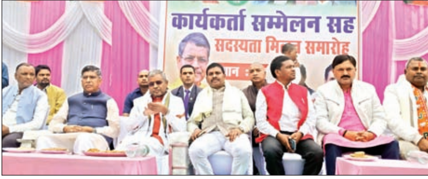
कार्यक्रम में मौजूद पूर्व मुख्यमंत्री बाबूलाल मरांडी व अन्य।