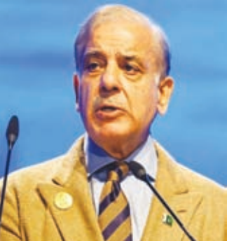
जरदारी के नाना जुल्फिकार अली भुट्टो के बलिदानों को हमेशा याद रखेंगे। जब शहबाज शरीफ ने बोला शुरु किया, तो पीटीआई समर्थित सदस्यों ने चोर के नारे लगाने शुरू कर दिये।

नवनिर्वाचित पीएम शहबाज ने कहा कि इस संसद में ऐसे प्रतिभाशाली लोग बैठें हैं, जो पाकिस्तान की नैया पार लगा सकते हैं। इनमें पत्रकार, बुद्धिजीवी, नेता, धार्मिक नेता शामिल हैं। उन्होंने कहा कि पाकिस्तान के सामने एक बड़ी चुनौती और अवसर था। उन्होंने कहा, अगर हम एक साथ आते हैं और पाकिस्तान के भाग्य को बदलने का फैसला करते हैं, तो इंशाअल्लाह हम इन चुनौतियों को पारस्त करेंगे। पाकिस्तान को उसके सही मुकाम तक लेकर जाएंगे। उन्होंने कहा कि यह काम मुश्किल है, लेकिन नामुमकिन नहीं है।