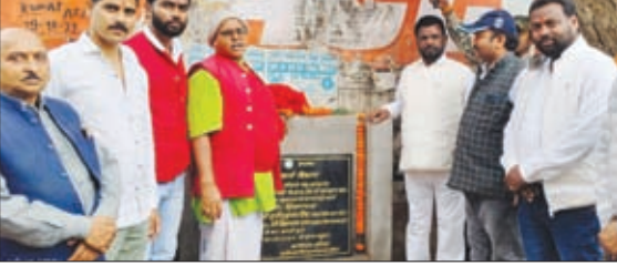
सड़क निर्माण की आधारशिला रखते विधायक व अन्य।