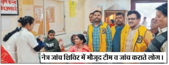
नेत्र जांच शिविर में मौजूद टीम व जांच करते लोग।