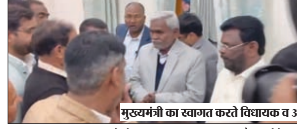
मुख्यमंत्री का स्वागत करते विधायक व अन्वू।

लातेहार। झारखंड के मुख्यमंत्री चण्डी सौरभ गढ़वा में आयोजित कार्यक्रम में भाग लेने जाने के दौरान रविवार को लातेहार परिषदन भवन में रुके। जहां जेएमएसए के कार्यकर्ताओं ने जोरदार स्वागत किया। इस दौरान पत्रकारों से बातचीत में कहा कि झारखंड अलग बने 24 साल हो गए। जिसमें सबसे ज्यादा भाजपा का शासन रहा। उनके शासनकाल में भौगोलिक स्थिति को देखते हुए कार्य नहीं की गई है। लेकिन