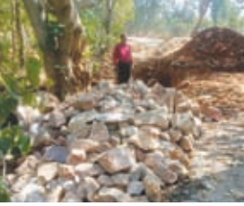
घटिया पत्थर को दिखाते पंसस।