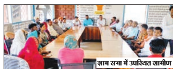
ग्राम सभा में उपस्थित ग्रामीण।