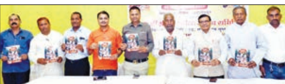
कथा के आयोजन का आरंभण पत्र विमोचित करते आयोजन समिति के पदाधिकारी।