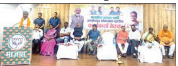
चैंबर भवन में आयोजित संयुक्त बैठक में जीत का मंत्र देते बाबूलाल मरांडी।

जमशेदपुर। भाजपा ने आगामी लोकसभा चुनाव में अपने तैयारियों को तेज करते हुए जमशेदपुर महानगर एवं जमशेदपुर ग्रामीण की संयुक्त बैठक का आयोजन किया। बिस्टुपुर स्थित चैंबर भवन के सभागार में लोकसभा चुनाव प्रबंधन की बैठक में भाजपा झारखंड प्रदेश अध्यक्ष बाबूलाल मरांडी मुख्यरूप से शामिल हुए। इस दौरान जमशेदपुर सांसद विद्युत चरण महतो, पूर्व प्रदेश अध्यक्ष डॉ