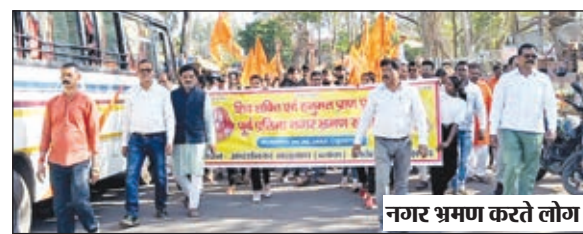
नगर भ्रमण करते लोग।