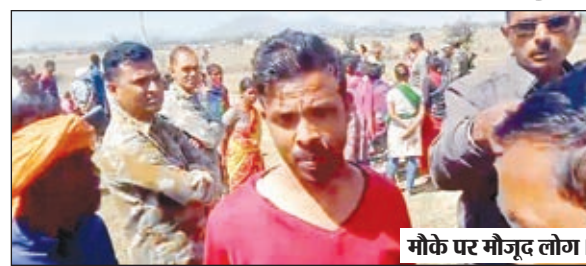
मौके पर मौजूद लोग।