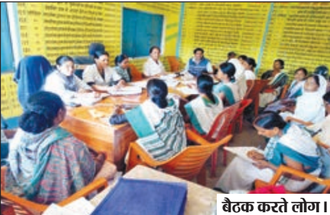
बैठक करते लोग।