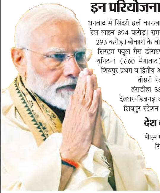
गोरखपुर और रामगुंडम में उर्वरक संयंत्रों के पुनरुद्धार के बाद यह देश में पुनर्जीवित होने वाला तीसरा उर्वरक संयंत्र है, जिन्हें क्रमशः दिसंबर 2021 और नवंबर 2022 में प्रधान मंत्री द्वारा राष्ट्र को समर्पित किया गया था।

झारखंड में 17,600 करोड़ रुपये से अधिक की कई रेल परियोजनाओं का उद्घाटन, लोकार्पण और शिलान्यास करेंगे। परियोजनाओं में सोन नगर-अंडाल को जोड़ने वाली तीसरी और चौथी लाइन शामिल है। टोरी-शिवपुर पहली और दूसरी और बिराटोली-शिवपुर तीसरी रेलवे लाइन (टोरी-शिवपुर परियोजना का हिस्सा), मोहनपुर-हंसडीहा नई रेल लाइन, धनबाद-चंद्रपुरा रेल लाइन व अन्य। इन परियोजनाओं से राज्य में रेल सेवाओं का विस्तार होगा और क्षेत्र में सामाजिक-आर्थिक विकास होगा। इसके अलावा वह तीन ट्रेनों को हरी झंडी भी दिखायेंगे। इनमें देवघर-डिब्रुगढ़ ट्रेन सेवा, टाटानगर और बादामपहाड़ के बीच मेमू ट्रेन सेवा (दैनिक) और शिवपुर स्टेशन से लंबी दूरी की मालगाड़ी शामिल है।