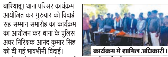
कार्यक्रम में शामिल अधिकारी।