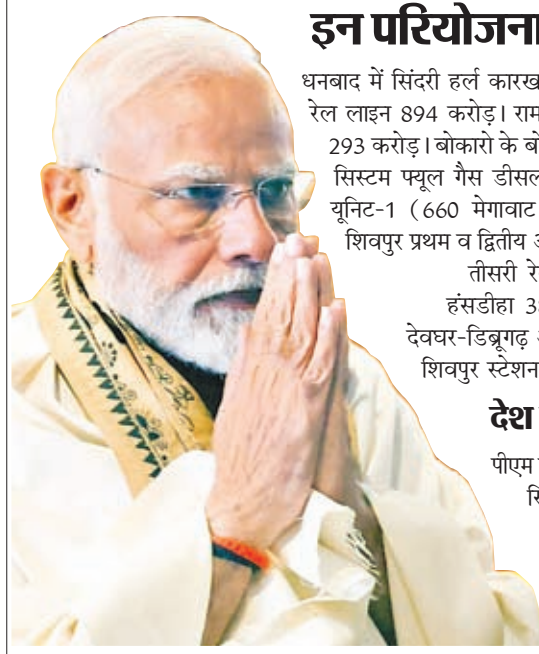
गोरखपुर और रामगुंडम में उर्वरक संयंत्रों के पुनरुद्धार के बाद यह देश में पुनर्जीवित होने वाला तीसरा उर्वरक संयंत्र है, जिन्हें क्रमशः दिसंबर 2021 और नवंबर 2022 में प्रधान मंत्री द्वारा राष्ट्र को समर्पित किया गया था।

झारखंड में 17,600 करोड़ रुपये से अधिक की कई रेल परियोजनाओं का उद्घाटन, लोकार्पण और शिलान्यास करेंगे। परियोजनाओं में सोन नगर-अंडाल को जोड़ने वाली तीसरी और चौथी लाइन शामिल है। टोरी-शिवपुर पहली और दूसरी और बिराटोली-शिवपुर तीसरी रेलवे लाइन (टोरी-शिवपुर परियोजना का हिस्सा), मोहनपुर-हंसडीहा नई रेल लाइन, धनबाद-चंद्रपुरा रेल लाइन व अन्य। इन परियोजनाओं से राज्य में रेल सेवाओं का विस्तार होगा और क्षेत्र में सामाजिक-आर्थिक विकास होगा। इसके अलावा वह तीन ट्रेनों को हरी झंडी भी दिखायेंगे। इनमें देवघर-डिब्रुगढ़ ट्रेन सेवा, टाटानगर और बादामपहाड़ के बीच मेमू ट्रेन सेवा (दैनिक) और शिवपुर स्टेशन से लंबी दूरी की मालगाड़ी शामिल है।