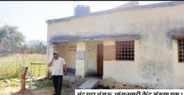
बंद पड़ा चुंगरु आंगनबाड़ी केंद्र संख्या एक।

है। आंगनबाड़ी सेविका व सहायिका सुधारने के लिए दिया जाने वाला के मनमाने रवैये से केंद्रों पर गर्भवती, पोषाहार इन्हें न मिलकर पशुओं का धात्री, किशोरी व नौनिहालों की सेहत आहार बन गया है।