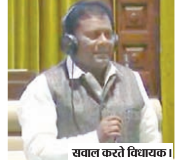
सवाल करते विधायक।

सड़क की दूरी लगभग 25 किलोमीटर है, जो पूरी तरह से जर्जर हो चुकी है। साथ ही यह क्षेत्र उग्रवाद प्रभावित होने के साथ-साथ पलामू, गढ़वा और छत्तीसगढ़ को जोड़ने वाली महत्वपूर्ण सड़क है। जिसके निर्माण को लेकर पथ निर्माण विभाग के द्वारा डीपीआर तैयार किया जा चुका है। जिसकी तकनीकी स्वीकृति भी मिल चुकी है, परंतु अब तक प्रशासनिक स्वीकृति नहीं होने के कारण यह सड़क अधर पृष्ठ है। जिसको लेकर सरकार इस महत्वपूर्ण