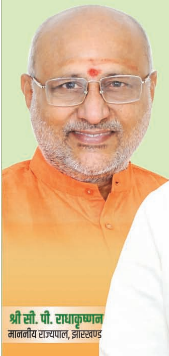
श्री सी. पी. राधाकृष्णन माननीय राज्यपाल, झारखण्ड