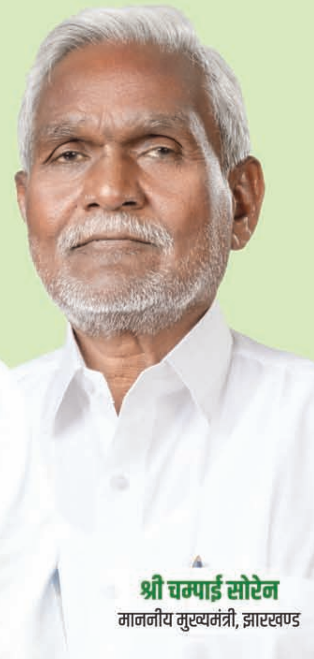
श्री चम्पाई सोरेन माननीय मुख्यमंत्री, झारखण्ड