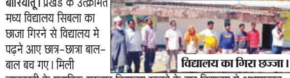
विद्यालय का गिरा छज्जा।