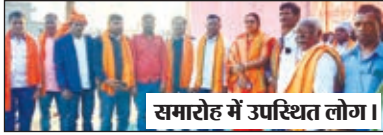
समारोह में उपस्थित लोग।

गणेशपुर में माता शबरी पूजा सह भुईयां मिलन समारोह का आयोजन