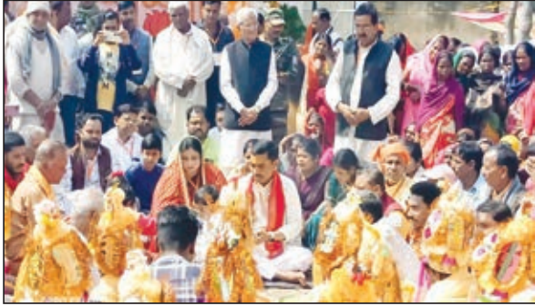
कन्यादान करते विधायक