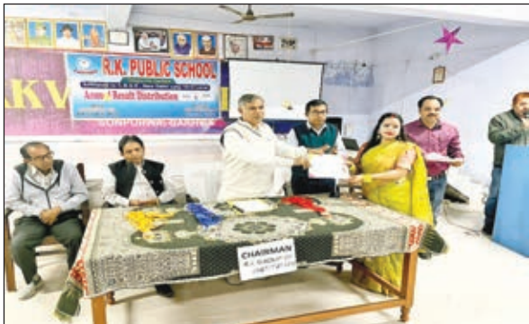
परीक्षाफल का वितरण करते निदेशक