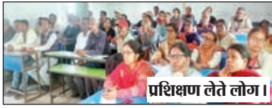
प्रशिक्षण लेते लोग।

लोक सभा चुनाव के निमित्त शिक्षकों व कर्मियों को दी गयी प्रारंभिक प्रशिक्षण