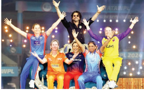
कप्तान को स्ट्रेज पर बुलाया और परफार्मस दी। कार्यक्रम की शुरूआत कार्तिक आर्यन ने धमाकेदार परफार्मस के साथ की। उन्होंने सफेद

नयी दिल्ली। महिला प्रीमियर लीग (WPL 2024) की ओपनिंग सेरेमनी में सुपरस्टार शाहरुख खान ने परफार्म कर सर्मा बांध दिया। दिग्गज फिल्मी सितारों के साथ महिला प्रीमियर लीग 2024 का रंगारंग उद्घाटन हुआ। सेरेमनी में शाहिद कपूर, कार्तिक आर्यन, सिद्धार्थ मल्होत्रा, टाइगर श्रॉफ, करुण धवन जैसे सितारों ने भी परफार्म किया। शाहरुख ने कार्यक्रम के दौरान लीग में हिस्सा ले रही पांचों टीमों की