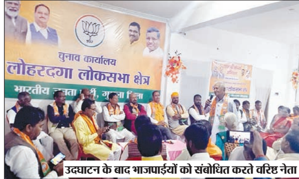
उद्घाटन के बाद भाजपाईयों को संबोधित करते वरिष्ठ नेता।