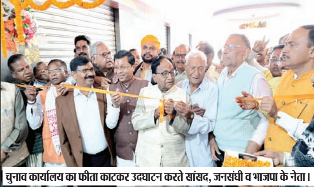
चुनाव कार्यालय का फीता काटकर उद्घाटन करते सांसद, जनसंघी व भाजपा के नेता।