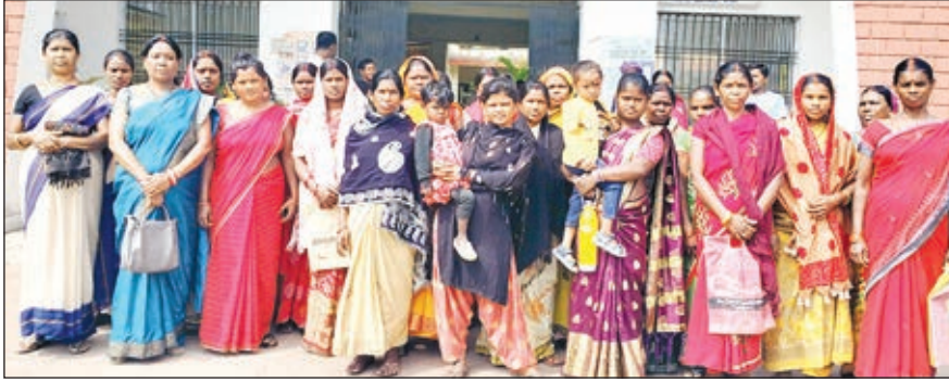
ओरमांडी मुख्यालय के समक्ष प्रदर्शन करतीं हरिजन महिलाएं।

ओरमांडी। प्रखंड में अबुआ आवास लाभुक चयन में जमकर गड़बड़ी की लेकर लगातर विरोध प्रदर्शन हो रहे हैं। ओरमांडी पंचायत में भी अबुआ आवास चयन में गड़बड़ी के खिलाफ गुरुवार को हरिजन महिलाओं द्वारा विरोध प्रदर्शन किया गया। विरोध प्रदर्शन में शामिल कई महिलाएं अपने छोटे-बच्चों को गोद में लेकर पहुंची थी। बताया गरीब जरूरतमंदों को अबुआ आवास नहीं देकर सामर्थ लोगों को योजना का लाभ दिया जा रहा है। ओरमांडी में तो एक परिवार में दो-दो लोगों को अबुआ आवास योजना के लिए चयनित किया गया