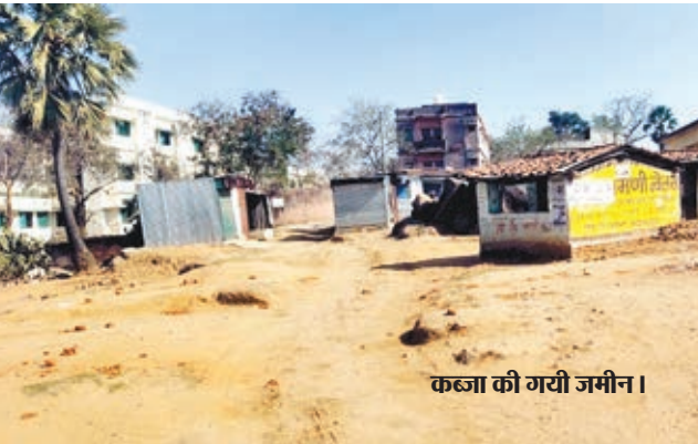
कब्जा की गयी जमीन।

बाजार समिति के परिसर की घेराबंदी कर के पूरा बाजार समिति को दुकान व घर बना कर के सरकारी जमीन को कुछ दबंग किसम के लोगों ने कब्जा कर के रख लिया गया। लगभग 5 से 7 एकड़ भू-क्षेत्र में बाजार समिति का परिसर है।