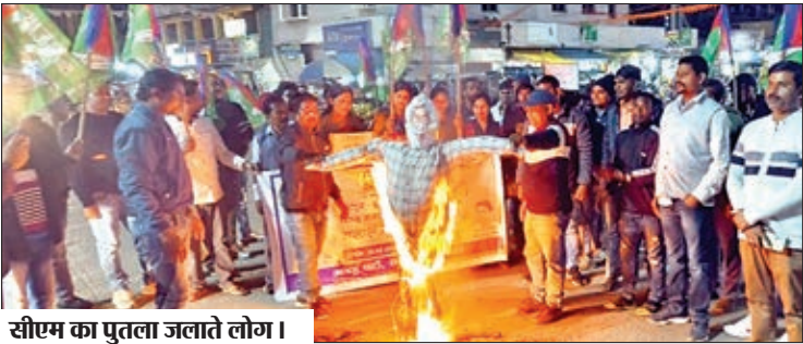
सीएम का पुतला जलाते लोग।