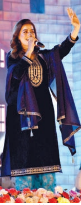
मंच पर प्रस्तुति देते गायिका अक्षरा सिंह