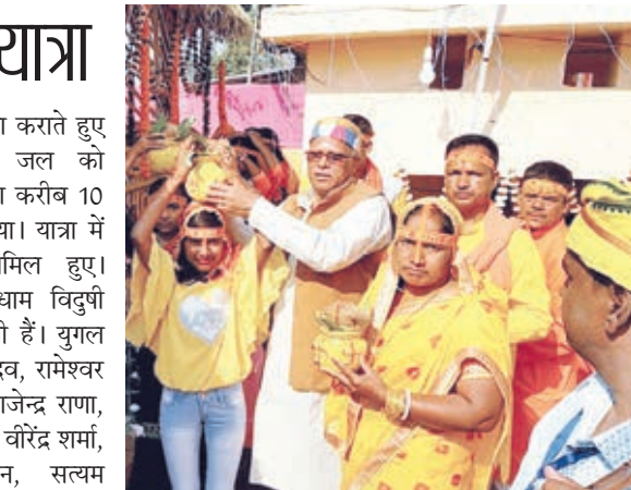
कलश यात्रा में विधायक और पूर्व विधायक।

देकर समानित किया गया। मौके पर डीआईजी सुनील भास्कर व एसपी अरविंद सिंह ने बधाई दी औरउज्वल भविष्य की कामना की। बता दें कि वर्तमान में के बी एस एस प्लस टू उच्च विद्यालय चौपराण से इंटर में पढ़ाई कर रहे हैं। पिछले साल एनसीसी नेशनल कैम्प का जिला चैंपियन भी रह चुका है। इनकी प्रबल इच्छा है कि वे देश के लोगों की सेवा करें और अपना योगदान देकर लोगों के बीच अपना प्यार बनकर सुरक्षा बल में जाकर अपने गांव, जिला राज्य को अच्छे दिशा की ओर ले जाने की कामना है।