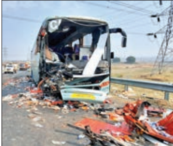
दुर्घटनाग्रस्त बस की तस्वीर।

नामकुम। थानाक्षेत्र के बडाम कव्वाली समीप रिंगरोड पर हुई सडक दुघटना में दो लोगों की मौत हो गयी। बताया जा रहा है कि रिंगरोड रोड पर सोमवार रात लगभग म्यारह बजे टाटीसिलवे की ओर से आ रही एक बस संख्या एचआर55एजी 3549 की विपरीत दिशा से आ रहे ट्रक संख्या जेएच05बीडी 8344 से आमने सामने टक्कर हो गयी। जिसमें बस के परखच्चे उड़ गए और ट्रक पलट गया दुघटना में दो वाहनों के चालक की मौके पर ही मौत हो गयी। घटना की जानकारी मिलते ही मौके पर पहुंची