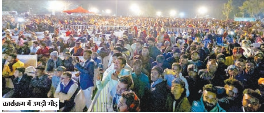
कार्यक्रम में उमड़ी भीड़

इटखोरी। महोत्सव के पहले दिन 19 फरवरी को सांस्कृतिक कार्यक्रम देखने के लिए जनसैलाव उमड़ पड़ा। महोत्सव के पहले दिन के कार्यक्रम में लाखों की संख्या में उपस्थित दर्शकों ने सांस्कृतिक कार्यक्रम का आनन्द उठाया। पूरा मैदान खचाखच भरा था। ब्लॉक मोड़ से लेकर कार्यक्रम स्थल तक