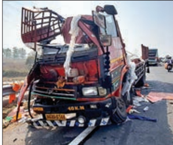
दुर्घटनाग्रस्त ट्रक की तस्वीर।

नामकुम पुलिस ने दोनों चालकों के शव को निकलवा कर पोस्टमार्टम हेतु रिम्स भिजवाया। ट्रक चालक की शिनाख्त