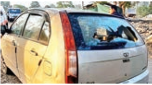
कार का शीशा फूटा।

➔ स्विफ्ट कार पर अपराधियों ने चलायी गोली, मजदूरों में दहशत ➔ 8 एमएम का एक जिंदा गोली और खोखा बरामद, मामले की जांच पड़ताल में जुटी पुलिस