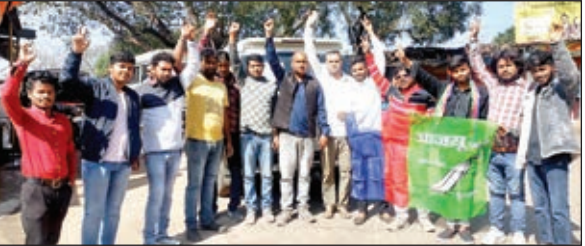
रवाना होते छत्र संघ

एक दिवसीय प्रदर्शन में शामिल होने के लिए आजसू कार्यकर्ता रांची रवाना