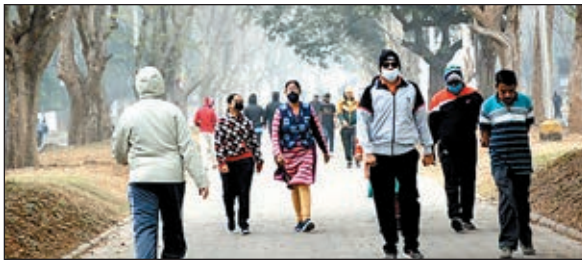
तापमान की बात करें तो आज 18 फरवरी तक तापमान में तीन डिग्री तक की गिरावट दर्ज

के समय मौसम साफ रहेगा। मौसम शुष्क रहने से लोगों को दिन के समय धूप मिलेगी। वहीं, 19 फरवरी से फिर से मौसम में बदलाव देखा जायेगा। जहां 20 फरवरी से राज्य में आंशिक बादल छाये रहेंगे। इस दौरान 22 फरवरी तक राज्य के अलग अलग हिस्सों में बादल छाये रहने की जानकारी दी गयी है। हालांकि बादल छाये रहने के दौरान राज्य का मौसम शुष्क बना रहेगा।