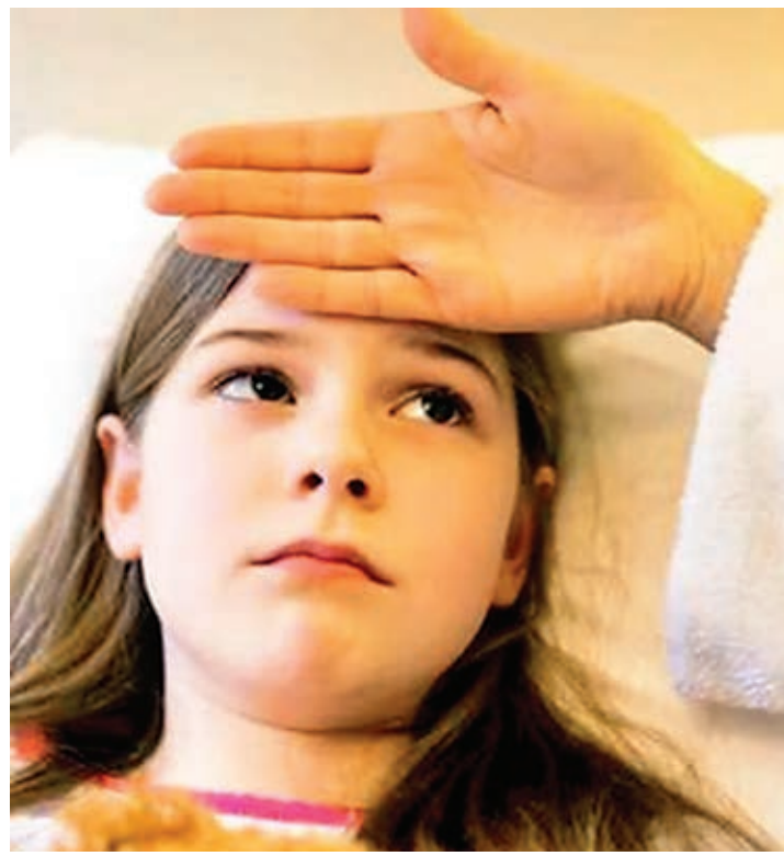
वायरल या बैक्टीरियल इन्फेक्शन ही नहीं लूज मोशन और फीवर जैसी समस्याएँ हो सकती हैं।

अब ठंड धीरे-धीरे जा रही है और गर्मी का मौसम दस्तक दे रहा है। इस बदलते मौसम और तापमान में उतार-चढ़ाव के बीच कई बीमारियों का खतरा भी बढ़ गया है। सुबह-शाम ठंड और दोपहर का मौसम गर्म हो रहा है। ऐसे में तबीयत खराब होने की समस्याएँ देखी जा रही हैं। बच्चों के लिए तो यह मौसम ज्यादा ही खराब माना जाता है। इस मौसम में उन्हें सर्दी-जुकाम,