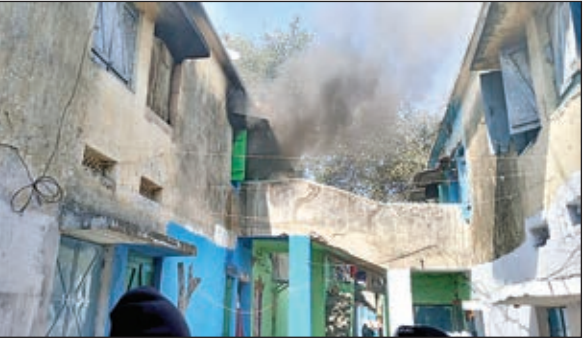
क्वार्टर में आग लगने से निकलता धुंवा

कमरे में रखे करीब 5 लाख रुपए मूल्य के सामान जलकर राख, बाल-बाल बची महिला