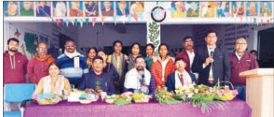
सेमिनार में शामिल लोग।