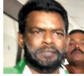
ने पूरी तैयारी की थी। लेकिन वह राजभवन पहुंचे ही नहीं।

पिछले 10 सालों से झारखंड में मुख्यमंत्री समेत 11 मंत्री ही रहे हैं। जबकि झारखंड विधानसभा का समीकरण बताया है कि सुबे में 12 मंत्री हो सकते हैं। रघुवर और हेमंत की तरह चंपई ने भी 12वां मंत्री पद खाली रखा है। कांग्रेस हमेशा से दबाव बनाती रही कि उनके पांच मंत्री हों। फॉर्मल के मुताबिक कांग्रेस पांच मंत्री का