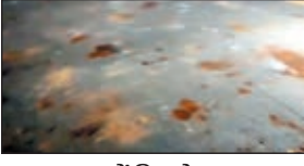
घटना में खिलेरे पत्थर

रांची/नगड़ी। रांची जिले के नगड़ी में शुक्रवार को विरसुन जुलूस के दौरान कहीं से एक पत्थर आकर गिरा। पत्थर गिरने से एक व्यक्ति जखमी हो गया। उसके बाद दोनों तरफ से पत्थरबाजी और नारेबाजी हुई। घटना रात आठ बजे की है। सूचना के मुताबिक मौके पर पहुंचे एक पुलिस अधिकारी की गाड़ी भी पत्थरबाजी में क्षतिग्रस्त होने की सूचना है। देर रात तक पुलिस के वरीय अधिकारी घटनास्थल पर