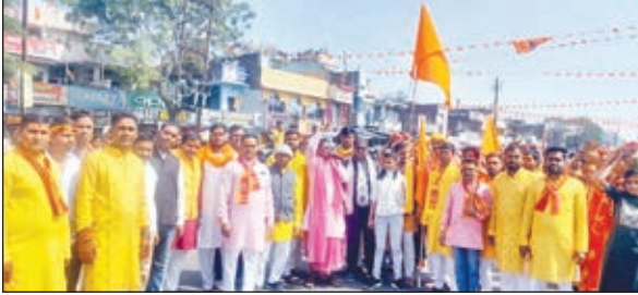
कलश यात्रा में शामिल श्रद्धालु।