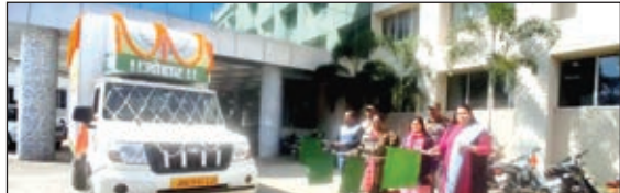
रथ रवाना करती उपायुक्त।