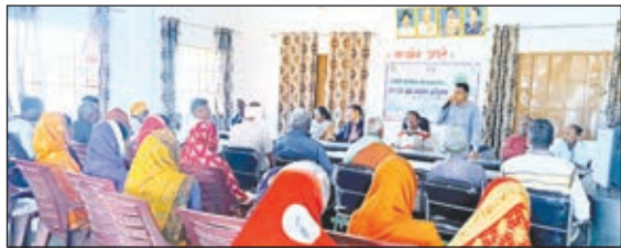
किसानों को खेती का गुर बताते विशेषज्ञ।