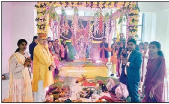
पूजा करते विद्यार्थी।