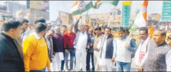
सड़क पर उतरे कांग्रेसी।