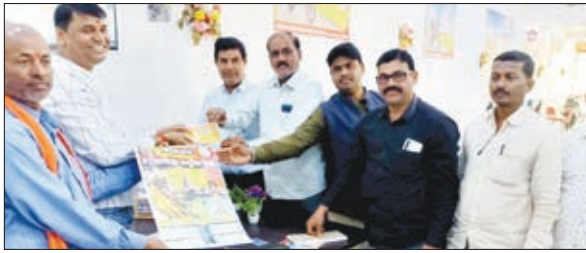
आमंत्रण पत्र देते लोग