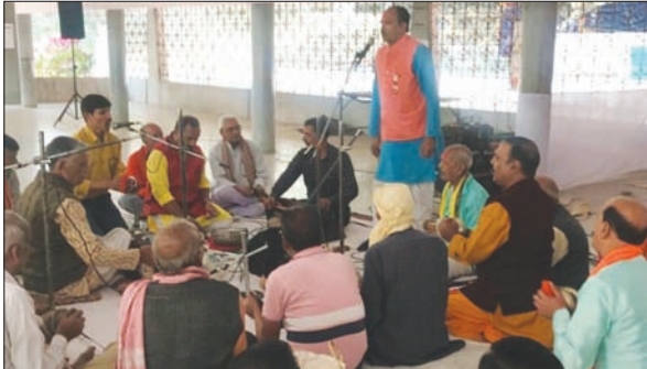
टेलको श्रीराम मंदिर में फगुआ के गीतों पर झूमते श्रीराम भक्त।

जमशेदपुर। हर वर्ष वसंत पंचमी के पावन दिन को ही श्रीराम मंदिर, टेलको का प्राण प्रतिष्ठा दिवस के रूप में मनाया जाता है। प्राण प्रतिष्ठा समारोह इस वर्ष भी बड़े विधि पूर्वक उत्साह एवम धूमधाम से मनाया गया। इस वर्ष प्राण प्रतिष्ठा दिवस के पहले दिन मंगलवार से चौबीस घंटे का अष्टयाम हरिकीर्तन जमशेदपुर की विभिन्न भजन मंडलियों द्वारा किया गया। इस दौरान पूरा मंदिर परिसर हरे राम,हरे कृष्ण हरिकीर्तन से गुंजायमान रहा। साथ ही रामचरित मानस रामायण का पाठ भी होता रहा। दूसरे दिन (14/02/2024) यानि बसंत पंचमी के दिन अष्टयाम के समापन के बाद आरती और हवन के साथ अनुष्ठान की पूर्णाहुति हुई। बसंत पंचमी, विद्या की देवी मां सरस्वती के चरणों में अबीर-गुलाल चढ़ाने के बाद दोपहर में फगुआ गायन का आगाज हुआ। बावगोड़ा, बारीगोड़ा रामायण मंडली द्वारा फगुआ गायन की प्रस्तुति दी गई। इस दौरान एक से बड़कर एक पारम्परिक फगुआ गीतों की प्रस्तुति मंडली द्वारा की गई। अनुष्ठान के अवसर पर श्रद्धालुओं के बीच प्रसाद का