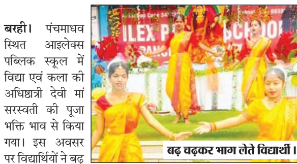
बड़ चढ़कर भाग लेते विद्यार्थी।