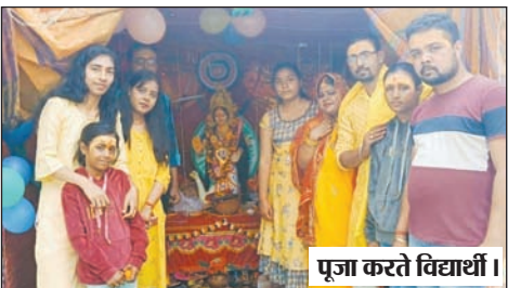
पूजा करते विद्यार्थी।

गढ़वा। बसंत पंचमी के मौके पर विद्या की अधिष्ठात्री मां सरस्वती की जिलेभर में काफी धूमधाम से पूजा अर्चना की गई। शहर से लेकर गांव तक सरस्वती पूजा की धूम रही। विद्यार्थियों ने शहर से लेकर गांव तक विभिन्न गली, मोहल्ले में जगह-जगह पर मां सरस्वती की प्रतिमा स्थापित कर पूजा अर्चना की एवं मां सरस्वती से बुद्धि एवं विद्या देने की प्रार्थना की। या देवी सर्वभूतेषु सरस्वती रूपेण संस्थिता नमस्तस्यै नमस्तस्यै नमस्तस्यै नमो नमः से पूरा गढ़वा गुंजायमान रहा। चारों तरफ माहौल भक्तिमय बना रहा। छोटे-छोटे बच्चों से लेकर बड़े विद्यार्थीगण दो दिन तक से ही मां सरस्वती पूजा की तैयारी में लगे हुए थे। चारों तरफ भक्ति गीत गुंजते रहे। लोगों ने काफी विधि विधान से मां सरस्वती की पूजा अर्चना की। सभी मूर्ति स्थल पर पूजा के बाद से प्रसाद वितरण भी किया गया। शहर के रांकी मोहल्ला, संघत मोहल्ला, मेन रोड, चिनिया मोड़ सहित विभिन्न मोहल्लों, गलियों में भी कई स्थानों पर मां सरस्वती की प्रतिमा स्थापित की गई है। सरस्वती पूजा की लेकर बच्चों में करीब 15 दिन पूर्व से काफी उत्साह था। हर गली में बच्चे चंदा काटते हुए देखे जा रहे थे।