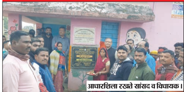
आधारशिला रखते सांसद व विधायक।

कटकमदाग। बसंत पंचमी के शुभ अवसर पर हजारीबाग सदर विधानसभा क्षेत्र के कटकमदाग प्रखंड क्षेत्र में हजारीबाग सांसद जयंत सिन्हा और हजारीबाग सदर विधायक मनीष जायसवाल ने संयुक्त रूप से 85 लाख रुपए की विकास योजनाओं की आधारशिला रखी। सांसद- विधायक ने संयुक्त रूप से कटकम डाक प्रखंड क्षेत्र के डेंगुरा पंचायत का दौरा किया और स्थानीय लोगों के बीच पहुंचकर पिछले करीब 10 सालों में हुए मोदी सरकार के विकास योजनाओं को खरा और