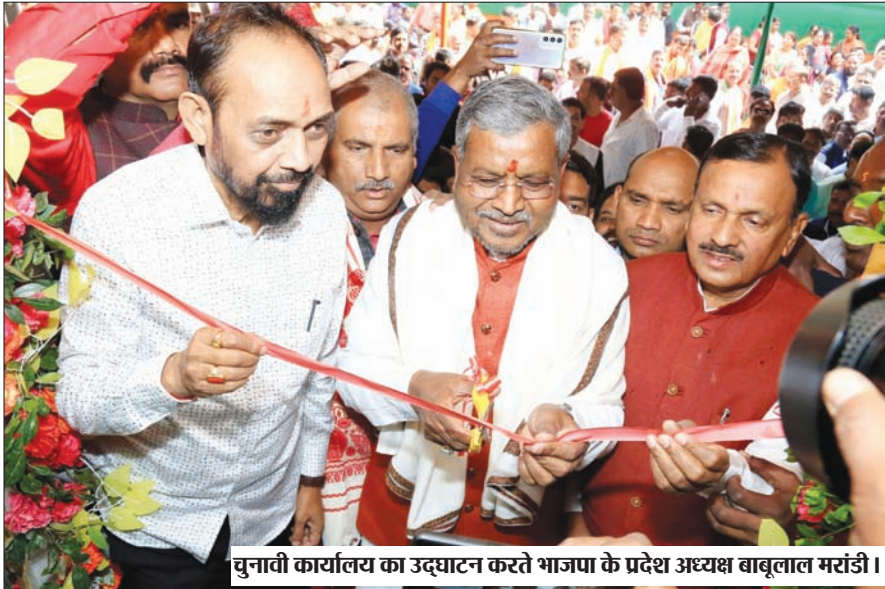
वृणादी कार्यालय का उद्घाटन करते भाजपा के प्रदेश अध्यक्ष बाबूलाल मरांडी।