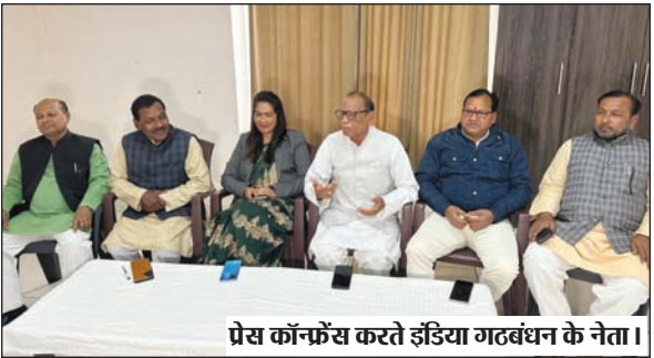
प्रेस कॉन्फ्रेंस करते इंडिया गठबंधन के नेता।

इंडिया गठबंधन के नेताओं ने कहा कि घूरन राम को पहली बार सांसद बनने का मौका राष्ट्रीय