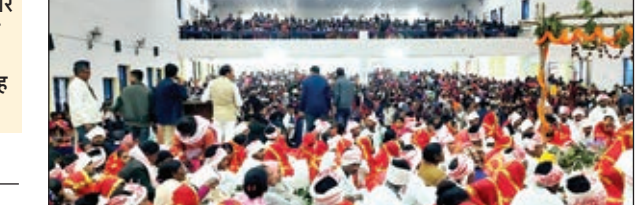
खबर मंत्र संवाददाता

लोहरदगा। ह्यूमन ड्राइड ग्लोबल फाऊंडेशन नामक संस्था द्वारा 151 आदिवासी कन्याओं का सामूहिक विवाह अनुष्ठान करया गया। बीएस कॉलेज स्टेडियम और सभागार में आयोजित इस कार्यक्रम में लोहरदगा और आसपास के जिलों के ऐसे युवक युवती विवाह रचाने पहुंचे जिन्होंने सामाजिक रीति से विवाह नहीं रचाया था मगर पति-पत्नी के रूप में साथ में रह रहे थे। मगर समाज और परिवार में इनके संबंध को मान्यता नहीं थी। राष्ट्रीय महिला दिवस के मौके पर आदिवासी कन्याओं के सम्मान और उनके दांपत्य जीवन को सामाजिक पहचान दिलाने के मकसद से यह कार्यक्रम