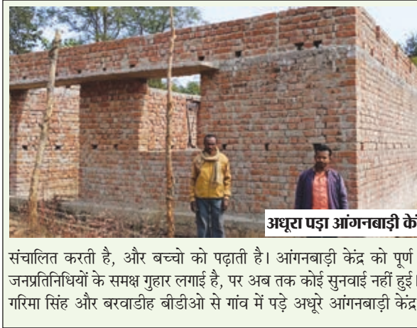
अधूरा पड़ा आंगनबाड़ी केंद्र ।

बरवाडीह। स्वास्थ्य सुविधाओं को बेहतर बनाने, नौनिहालों को कुपोषण से बचाने और उन्हें शिक्षा के प्रति जागृत करने, गर्भवती महिलाओं को समय-समय पर टीकाकरण आदि की व्यवस्था देने के उद्देश्य से बीते दो वर्ष पूर्व गांवों में आंगनबाड़ी केंद्र का भवन बनाने को लेकर बजट आवंटित किया था। लेकिन विभागीय उदासीनता के