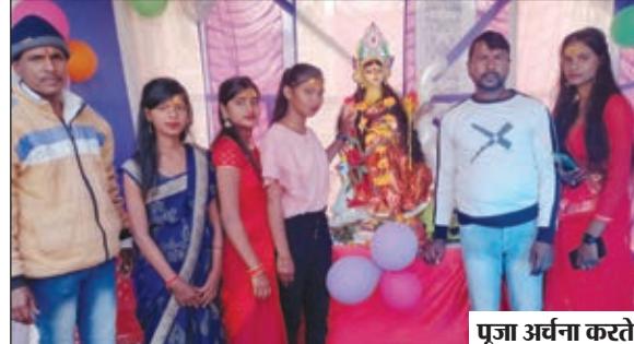
पूजा अर्चना करते।

मां। बसंत पंचमी के शुभ अवसर पर 14 फरवरी को मां और आसपास क्षेत्र में छात्र-छात्राओं और नवयुवकों ने माता सरस्वती की विधि पूर्वक पूजा अर्चना की। इस दौरान पूजा पंडालों को विद्युत लाइट की साज सजा कर ध्वनि साउंड डीजे और लोडोस्पीकर लगाकर सरस्वती मां के भक्तों एवं छात्राओं ने पुजारी के द्वारा मंत्र उच्चारण करके विधि पूर्वक पूजा अर्चना और आरती किये और मां सरस्वती से विद्या प्राप्ति और आशीर्वाद प्राप्त के लिए वंदना की। साथ ही साथ 3 वर्ष से 4 वर्ष के छोटे बच्चों को अभिभावक लोग अपने बच्चों को सरस्वती मां के प्रतिमा के सामने सिलेट बोर्ड और चौक खली के द्वारा ब्राह्मण और स्थानीय टीचर से पढ़ाई का शुरुआत कराए। श्रद्धालु महिला नवयुवक और युवतियां सभी पूजा पंडालों में सरस्वती मां का प्रतिमा और पूजा पंडाल देखने और प्रसाद ग्रहण करने के लिए दिन भर श्रद्धालुओं का भीड़ बना देखा। साथ ही साथ मां पूजा पूरे क्षेत्र में सरस्वती मां भक्ति गीतों के गुंज से पूरा मां भक्ति मय हो गया है। मां के प्राचीन शिव मंदिर, मणिपाल स्कूल, राधानगर, माती कृष्णा पब्लिक स्कूल, दिलीप अकैडमी, मां चट्टी, गरगाली, गोविंदपुर पुड़ी, पुड़ी बस्ती, बसोदी बस्ती, हेसागाड़ा इन क्षेत्रों में सरस्वती पूजा मनाया गया।