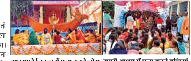
अवसफोर्ड स्कूल में पूजा करते लोग