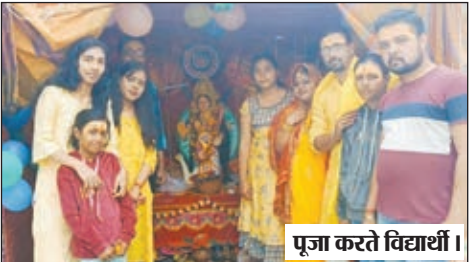
पूजा करते विद्यार्थी।

गढ़वा में धूमधाम से मनी सरस्वती पूजा, जगह-जगह पर स्थापित की गई प्रतिमा