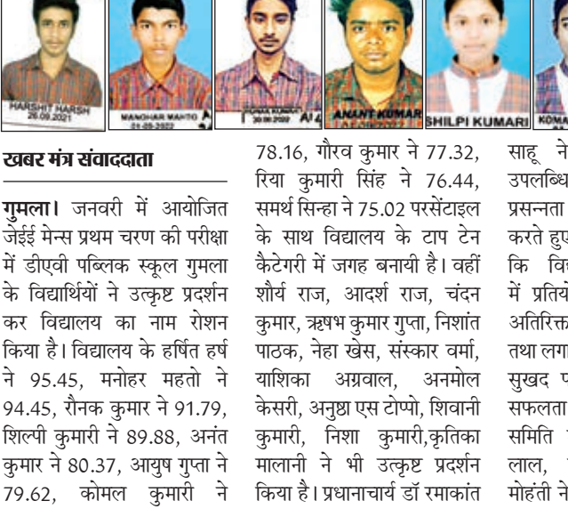
खबर मंत्र संवाददाता