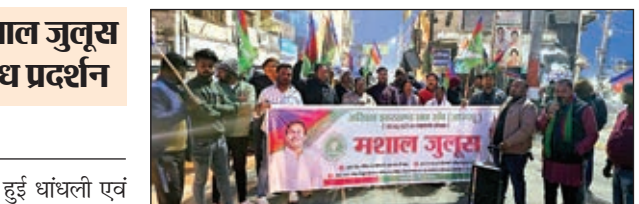
खबर मंत्र संवाददाता

मुहल्ले व गांवों में मां सरस्वती की प्रतिमा स्थापित कर पूजा अर्चना की गई। सभी पूजा पंडालों में मां के भक्ति व आराधना के गीत साउंड बॉक्स में बजते रहें। युवा व बच्चे मां की आराधना में झुमते भी नजर आवे। वहीं जिले के जारी,डुमरी, चैनपुर, रायडीह, विशुनपुर, घाघरा, सिसई, भरनो, कामडारा, बसिया, पालकोट प्रखंड सहित टोटो, मुरकुंडा आदि स्थानों में भी मां की प्रतिमा स्थापित कर भक्ति भाव से लोगों ने पूजा अर्चना की।