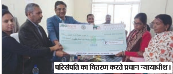
परिसंपत्ति का वितरण करते प्रधान न्यायाधीश ।