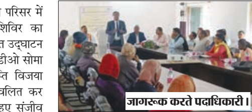
जागरूक करते पदाधिकारी ।