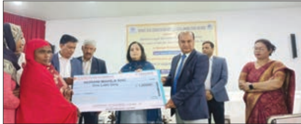
परिसंपत्ति का वितरण करते पदाधिकारी ।

में सहज और सरल तरीके से दूर दराज क्षेत्रों से आए ग्रामीणों और उपस्थित अन्य श्रोतागणों को आज के संदर्भ में विधिक सेवा सशक्तिकरण शिविर-सह-पोक्सो पर आयोजित जिला स्तरीय शिविर के बारे में विस्तार से जानकारी दी गई।