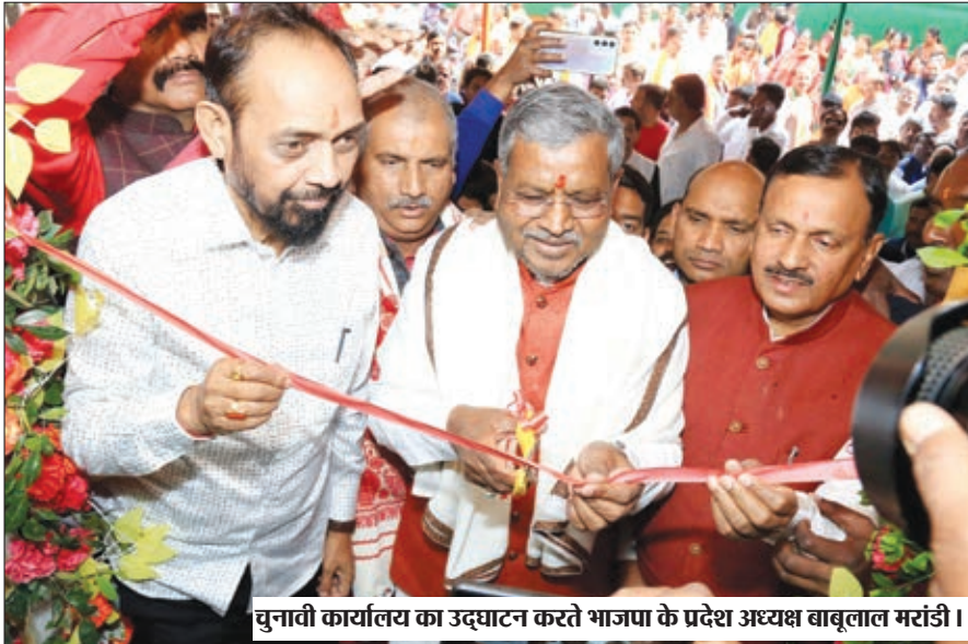
युवादी कार्यालय का उद्घाटन करते भाजपा के प्रदेश अध्यक्ष बाबूलाल मरांडी।