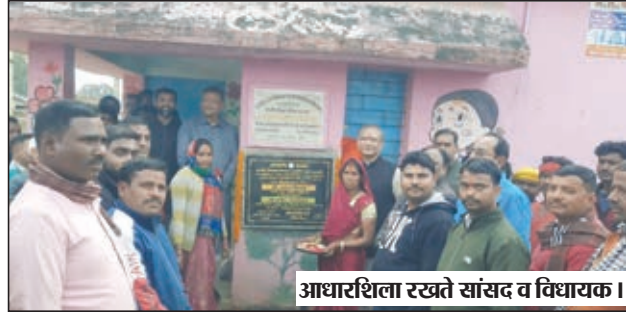
आधारशिला रखते सांसद व विधायक।

कटकमदाग। बसंत पंचमी के शुभ अवसर पर हजारीबाग सदर विधानसभा क्षेत्र के कटकमदाग प्रखंड क्षेत्र में हजारीबाग सांसद जयंत सिन्हा और हजारीबाग सदर विधायक मनीष जायसवाल ने संयुक्त रूप से 85 लाख रुपए की विकास योजनाओं की आधारशिला रखी। सांसद- विधायक ने संयुक्त रूप से कटकम डाक प्रखंड क्षेत्र के डेंगुरा पंचायत का दौरा किया और स्थानीय लोगों के बीच पहुंचकर पिछले करीब 10 सालों में हुए मोदी सरकार के विकास योजनाओं को खरा और