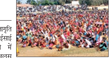
कार्यक्रम में सैकड़ों की संख्या में जुटे आदिवासी समाज के लोग ।

डुमरी। आदिवासी एकता मंच जागृति युवा क्लब नवाडीह के बैनर तले ईसाई आदिवासी समाज ने डुमरी में डिलिटिंग के विरोध में जुलूस निकाल कर विरोध प्रदर्शन किया। जिसमें प्रखंड के कई गांवों से हजारों की संख्या में जुटे ईसाई आदिवासियों ने हाथों में तख्तों लेकर आदिवासी एकता जंदाबाद, आदिवासियों को जाति धर्म के नाम पर लड़वाना बंद करो, देश के 32 जनजाति आदिवासी हम एक हैं धर्म जाति के नाम पर राजनीति बंद करो, आदिवासी को बनवासी कहना बंद करो कि जमकर नारे बाजी की। जुलूस डेरा मैदान से शुरू होकर क्रूस चौक, जीतिवाटोली से होते हुए ब्लॉक रोड से होकर प्रखंड