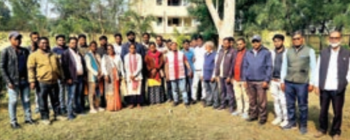
न्याय मार्च को लेकर रणनीति बनाते जेएमएम नेता ।