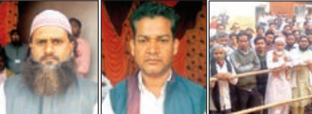
किसको कितना मिला मत