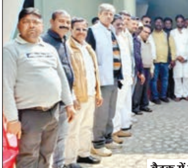
बैठक में उपस्थित कांग्रेस नेता और कार्यकर्ता।

हजारों कार्यकर्ता और पदाधिकारी न्याय यात्रा में शामिल होंगे। कांग्रेस कमेटी के द्वारा कार्यकर्ताओं की लिस्ट तैयार कर ली गई है। बताया कि देश विरोधी ताकतों के साथ मिलकर भाजपा भारतवर्ष को