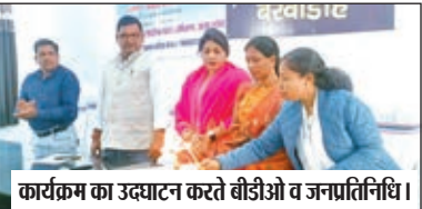
कार्यक्रम का उद्घाटन करते बीडीओ व जनप्रतिनिधि।