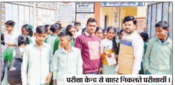
परीक्षा केन्द्र से वाहट निकलते परीक्षार्थी।

● मैट्रिक में सामाजिक विज्ञान की परीक्षा में 1702 उपस्थित व 14 रहे अनुपस्थित, इंटरमीडिएट भूगोल की परीक्षा में 6 रहे अनुपस्थित