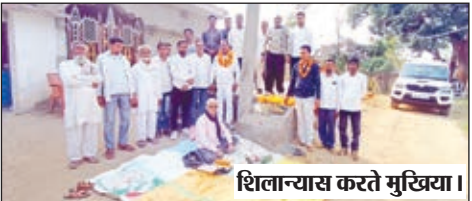
शिलान्यास करते मुखिया।

स्पीड न्यून मुखिया ने किया पीसीसी पथ का शिलान्यास