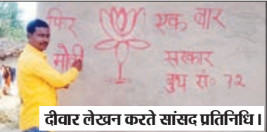
दीवार लेखन करते सांसद प्रतिनिधि।

दीवार लेखन कर फिर एक बार मोदी सरकार को लाने का दिलाया संकल्प