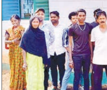
जानकारी देते स्थानीय ग्रामीण।