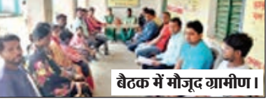
बैठक में मौजूद ग्रामीण।

शरारती तत्वों ने मवि अलौदिया में विद्युत वायर किया क्षतिग्रस्त