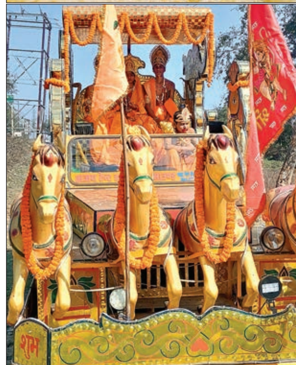
कलश में जल भरते श्रद्धालु और रथ पर सजा रामदरबार।