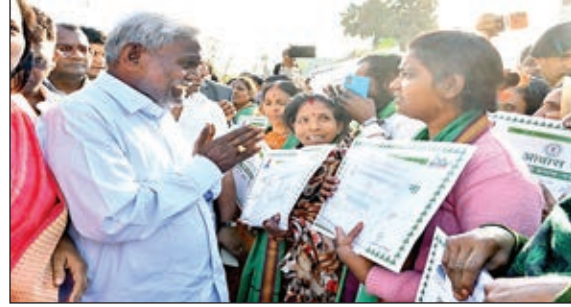
महिला लाभुकों का अभिवादन करते मुख्यमंत्री चंपई सोरेन।

और समाज के अंतिम पंक्ति के व्यक्ति को सरकारी योजनाओं से जोड़ने का काम हुआ। आज डीसी और एस्पपी से लेकर बोडीओ-सीओ आपके दरवाजे पर पहुंचकर पूरी संवेदनशीलता के साथ आपकी समस्याओं का समाधान कर रहे हैं। यह सिलसिला आगे लगातार जारी रहेगा। एक-एक व्यक्ति को हक-अधिकार और न्याय मिलेगा : मुख्यमंत्री ने कहा कि यह सरकार आपकी है। एक-एक व्यक्ति को पूरे मान सम्मान के साथ उसका हक अधिकार देगे। किसी के साथ कोई शोषण और अन्याय नहीं होगा। यहां हर किसी को न्याय मिलेगा। इसके साथ ही सरकार हर परिस्थिति में आदिवासियों-मूलवासियों, गरीबों और जरूरतमंदों के साथ खड़ी रहेगी, यह हमारा वादा है। मुख्यमंत्री ने कहा कि राज्य के सभी क्षेत्र के विकास के लिए सरकार संकल्पित है। यहां के खनिज संसाधन से पूरा देश जगमग करता है, उन खनिज संसाधनों का अब इस राज्य के हित में सदुपयोग होगा। औद्योगिक विकास के लिए