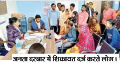
जनता दरबार में शिकायत दर्ज करते लोग ।