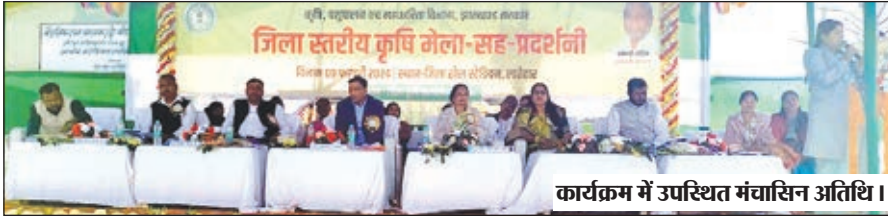
कार्यक्रम में उपस्थित मंचासिन अतिथि ।