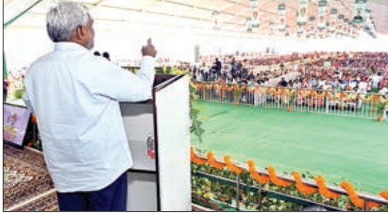
गोपाल मैदान में लाभुकों को संबोधित करते मुख्यमंत्री चंपई सोरेन।