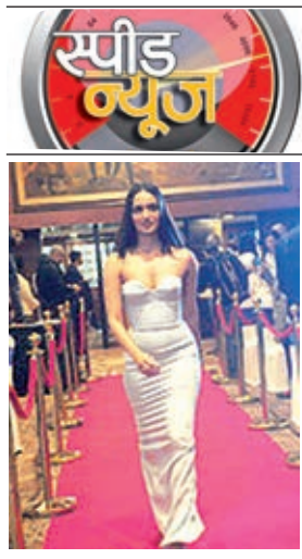
नयी दिल्ली में शुक्रवार को मिस वर्ल्ड की प्रेस लॉन्च में कैटवाक करती पूर्व मिस वर्ल्ड मानुषी खिल्लर ।