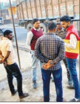
जांच करते नगर पंचायत अधिकारी ।