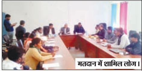
मतदान में शामिल लोग।

अविश्वास प्रस्ताव में उपप्रमुख के खिलाफ हुआ मतदान, उपप्रमुख पद हुआ निरस्त