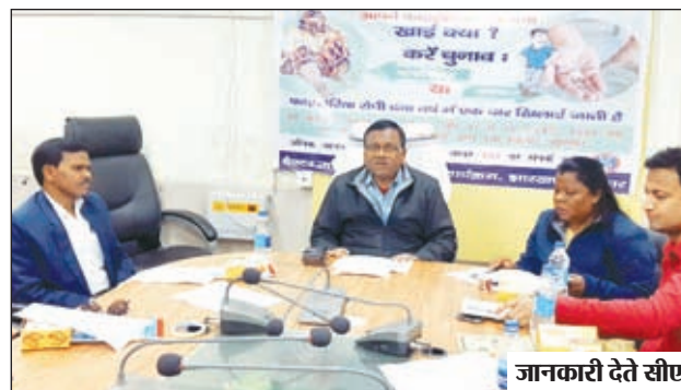
जानकारी देते सीएस।

लोहरदगा। जिले के सिविल सर्जन डॉ राजमोहन खलखो ने बताया कि जिले में आगामी 10 फरवरी से 25 फरवरी तक मास ड्रग एडमिनिस्ट्रेशन (टडअ) कार्यक्रम का आयोजन किया जाना है। इसके अंतर्गत 10 फरवरी को बूथ स्तर पर एवं दिनांक 11 से 25 फरवरी तक घर-घर भ्रमण कर लक्षित जनसंख्या को उम्र के अनुसार 0.1-0.5ml एवं अलबेंडाजोल की एक-एक खुराक खिलाई जायेगी। इस वर्ष लोहरदगा जिला में लगभग 2,59,286 (पांच लाख उनसठ हजार दो सौ छियासी) लोगों को दवा खिलाने का लक्ष्य रखा गया है। जिले में कुल 717 बूथ बनाये गये हैं। दवा खिलाने हेतु सभी सामुदायिक स्वास्थ्य केन्द्रों में लगभग 1500 कार्यकर्ताओं की प्रतिनियुक्ति की गई है। कार्यक्रम की सफलता हेतु व्यापक प्रचार प्रसार किया जा रहा है। सिविल सर्जन द्वारा लोहरदगा जिला के वासियों से अपील की गयी कि फाइलेरिया उन्मूलन के