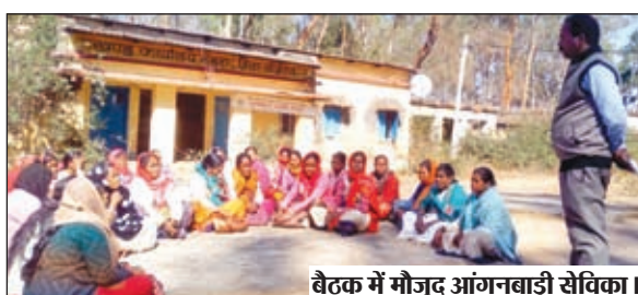
बैठक में मौजूद आंगनबाड़ी सेविका।