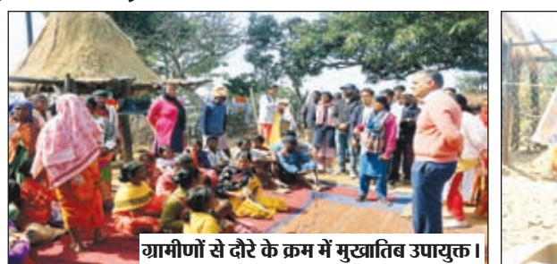
गांधीनों से लेते के क्रम में मुखातिब उपायुक्त।

गुमला। उपायुक्त कर्ण सत्यार्थी क्षेत्र भ्रमण के क्रम में गुरुवार को विशुनपुर प्रखंड के सुदूरवर्ती पाट क्षेत्र सरका पंचायत के हाडूप ग्राम अंतर्गत गाढ़ा हाडूप एवं कमरापाट हाडूप टोले का दौरा किया। विशुनपुर प्रखंड से लगभग 40 किलोमीटर दूर पाट क्षेत्र तक जाने वाली कच्ची सड़क को पार करने के पश्चात हाडूप ग्राम पहुंच कर उपायुक्त ने वहां के पीवीटीजी समुदाय के लोगों से मुलाकात कर उनकी समस्याओं को सुना। उपायुक्त के आने के उपलक्ष्य में हाडूप ग्राम के लगभग 20 पीवीटीजी परिवार वाले गाढ़ा हाडूप टोले में सभी परिवार के सदस्यों के बीच आयुष्मान कार्ड का वितरण किया गया। वहीं उक्त टोले में हेल्थ चेकअप कैंप का भी आयोजन किया गया। जहां सभी ग्रामीणों का निःशुल्क स्वास्थ्य जांच एवं दवा का वितरण किया गया। उपायुक्त ने उक्त टोले के ग्रामीणों के साथ बैठक कर उनकी समस्याओं को सुना एवं ग्रामीणों