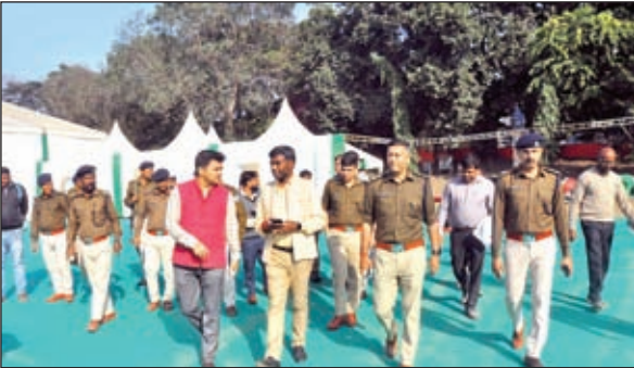
तैयारियों का जायजा लेकर लौटते डीसी व एसएसपी।

डीसी और एसएसपी ने गोपाल मैदान में तैयारियों का लिया जायजा, दिये आवश्यक निर्देश