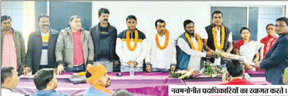
नवमनोनीत पदाधिकारियों का स्वागत करते।