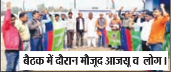
बैठक में दौरान मौजूद आजसू व लोग।

भुरकुंडा (रामगढ़)। आजसू पार्टी एवं अखिल झारखण्ड कोयला श्रमिक संघ की संयुक्त बैठक मंगलवार को बरका-सयाल आठ नंबर स्थित