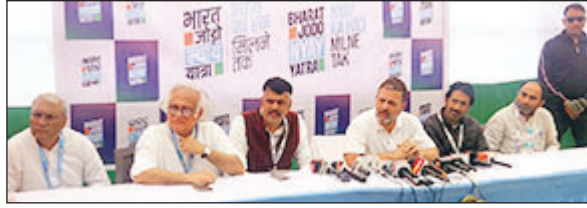
प्रेस कांफ्रेंस करते कांग्रेस के पूर्व राष्ट्रीय अध्यक्ष राहुल गांधी व अन्य ।

इन जातियों के विकास के लिए जातिगत जनगणना जरूरी है। कांग्रेस पार्टी देश में जातीय जनगणना जरूर कराएगी। देश के संस्थानों, कारपोरेटर घराने या अन्य किसी संस्थान में ओबीसी नहीं है।