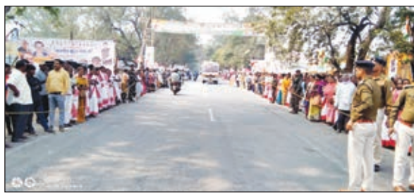
राहुल गांधी के स्वागत के लिए सड़क के दोनों किनारों पर खड़े लोग, राहुल गांधी के बसिया आगमन को लेकर उत्साहित कांग्रेसी