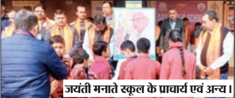
जयंती मनाते स्कूल के प्राचार्य एवं अन्य।