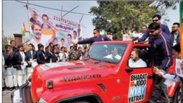
भारत जोड़ो न्याय यात्रा के तहत बसिया वाहन से पहुंचे राहुल गांधी, राहुल गांधी की एक झलक पाने को बसिया में उमड़ी भीड़

सड़क पर खड़े लोगों का राहुल गांधी ने अभिनंदन भी नहीं किया