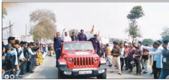
भारत जोड़ो न्याय यात्रा के दौरान वाहन पर बैठे रहे राहुल गांधी, राहुल गांधी को देखने पहुंचे स्कूली बच्चे