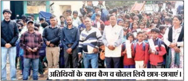
अतिथियों के साथ बैग व बोटल लिये छत्र-छत्राएँ।