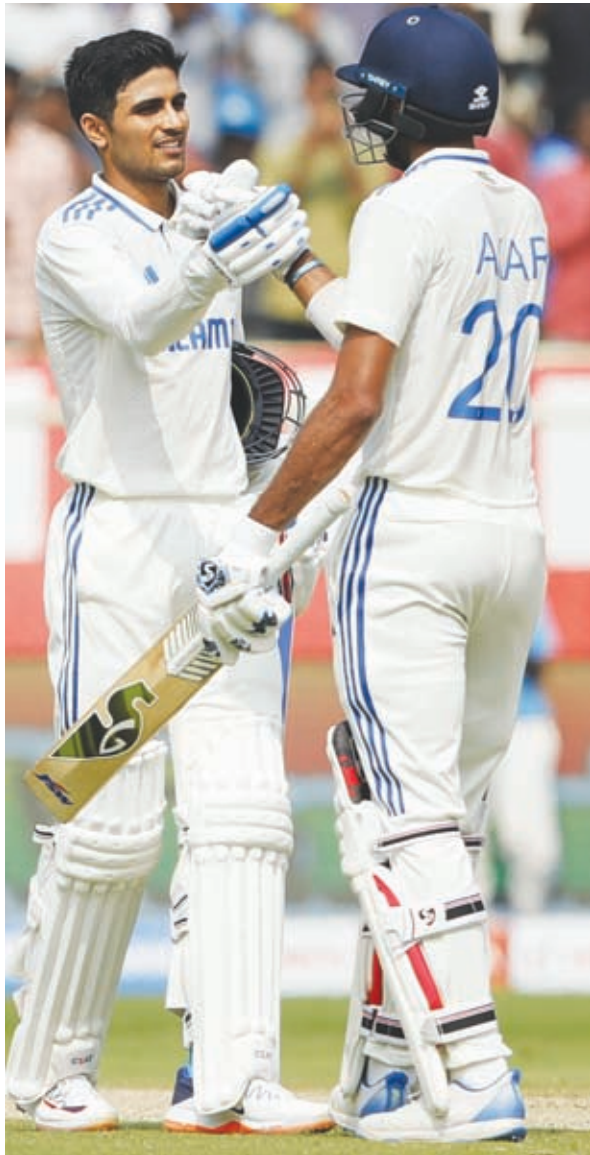
एजेंसी के बीच विशाखापत्तनम में खेला जा रहा पांच मैचों की टेस्ट सीरीज का दूसरा मुकाबला रोमांचक स्थिति में