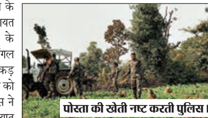
पोस्ता की खेती नष्ट करती पुलिस।