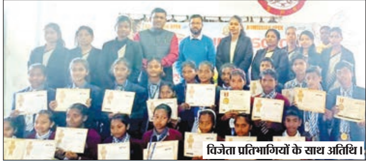
विजेता प्रतिभागियों के साथ अतिथि।

मतदान का उपयोग कर देशवासी देश को भ्रष्टाचार मुक्त कर सकते हैं : स्कूली बच्चे