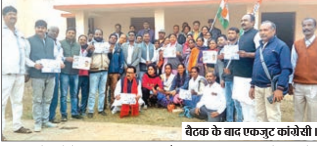
बैठक के बाद एकजुट कांग्रेसी।