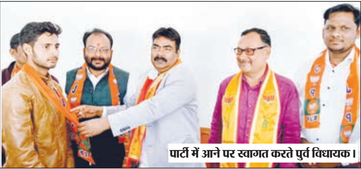
पार्टी में आने पर स्वागत करते पूर्व विधायक।