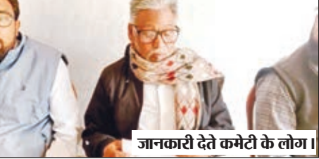
जानकारी देते कमेटी के लोग।

भंडरा अंजुमन इस्लामिया का चुनाव की तिथि की हुई घोषणा