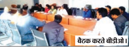
बैठक करते बीडीओ।

बीडीओ ने किया समीक्षात्मक बैठक, दिये कई दिशानिर्देश