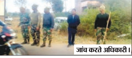
जांच करते अधिकारी।

विधि व्यवस्था को लेकर बीडीओ ने चलाया वाहन जांच अभियान