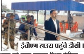
ईवीएम हाउस पहुंचे डीसी।

लोहरदगा। ईसीआईएल, हैदराबाद से प्राप्त ईवीएम का फर्स्ट लेवल चेकिंग