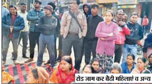
रोड जाम कर बैठी महिलाएं व अन्य।

गंदे पानी की सप्लाई के विरोध में आक्रोशित लोगों ने किया रोड जाम