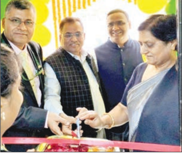
पंजाब एंड सिंध बैंक