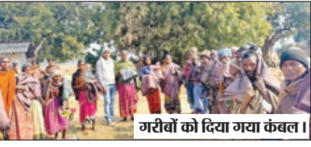
गरीबों को दिया गया कंबल।

हिंडालको सीएसआर ने असहाय लोगों के बीच किया कंबल का वितरण