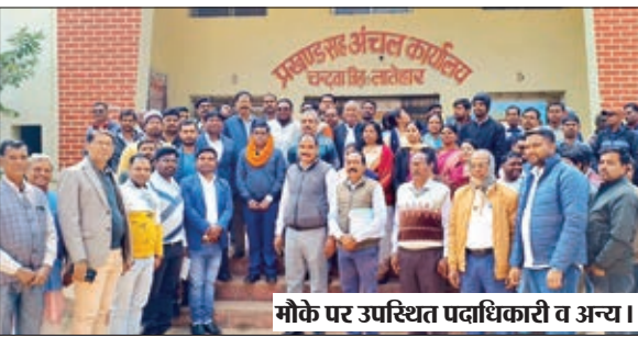
मौके पर उपस्थित पदाधिकारी व अन्य।