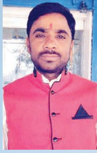
मुन्सी साव निवेदक प्रीस भारत गैस वितरक