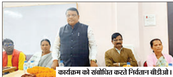
कार्यक्रम को संबोधित करते निवर्तमान बीडीओ।