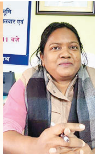
तृषि विजया कुजूर अंचलाधिकारी बालूमाथ