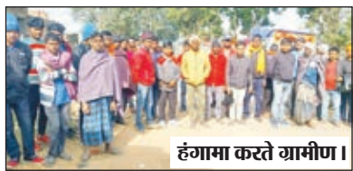
हंगामा करते ग्रामीण।

प्रसव हुई महिला की गई जान, ग्रामीणों ने काटा बवाल