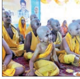
सहजम यज्ञोपवीत परम पवित्र प्रजापते रिवर सहजम पुरेतम भगवान श्रीमन्नारायण की प्रेरणा से ब्रह्मा जी के गले में यज्ञोपवीत देखा गया अर्थात वे चारों वेद के ज्ञाता हैं।