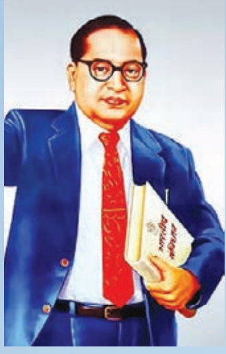
भीम अर्मी जिला कमिटि लातेहार