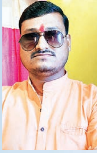
सोनु ट्रेड्स वरछिया बारियातू