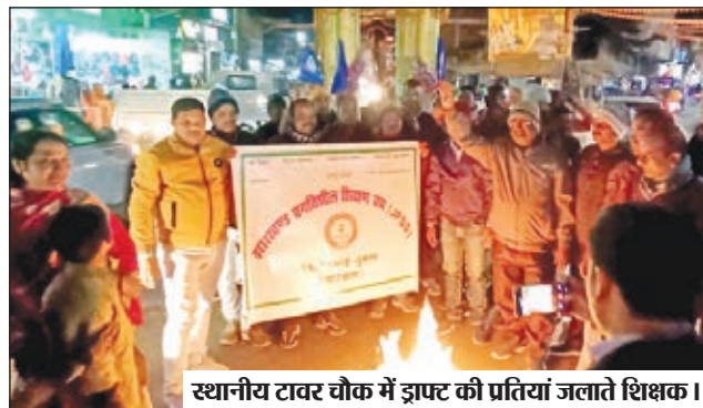
स्थानीय टावर चौक में झ्रफ्ट की प्रतियां जलाते शिक्षक।

● जलायी झ्रफ्ट की प्रति, टेट उतीर्ण शिक्षकों के साथ भेदभाव करने का आरोप