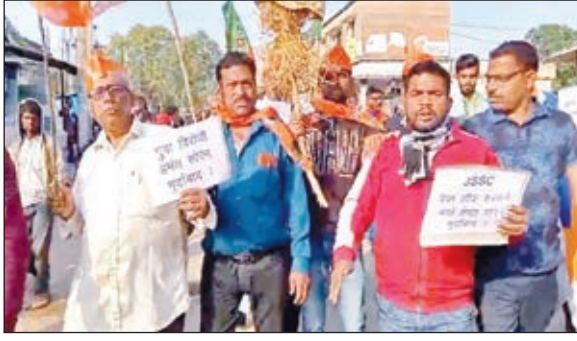
पुतला दहन करने जाते भाजपाई।