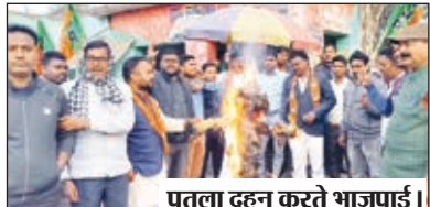
पुतला दहन करते भाजपाई।