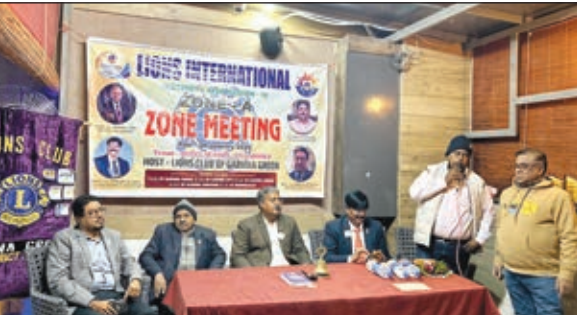
बैठक करते लोग।