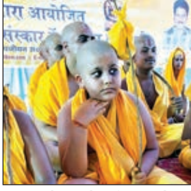
यज्ञोपवीत संस्कार के दौरान श्रद्धालुओं का दर्शन।