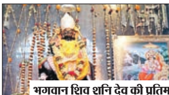
भगवान शिव शनि देव की प्रतिमा।