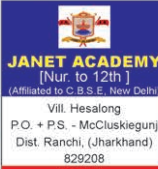
JANET ACADEMY [Nur. to 12th]

(Affiliated to C.B.S.E., New Delhi) Vill. Hesalong P.O. + P.S. - McCluskiegunj Dist. Ranchi, (Jharkhand) 829208 Website: www.janetacademy.com Contact No. : 8757093092