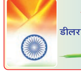
आपूर्ति शाखा डीलर संघ बुढ़मू, जिला-रांची।

गणतंत्र दिवस पर बुढ़मूवासियों को हार्दिक बधाई