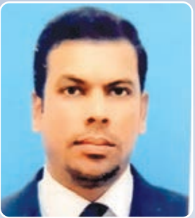
लेख राज नाग प्रखंड विकास पदाधिकारी खलारी