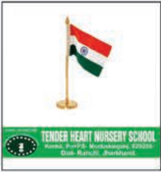
टेंडर हार्ट नर्सरी स्कूल