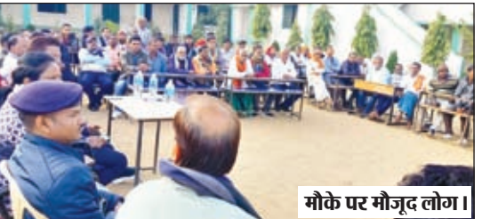
मौके पर मौजूद लोग।