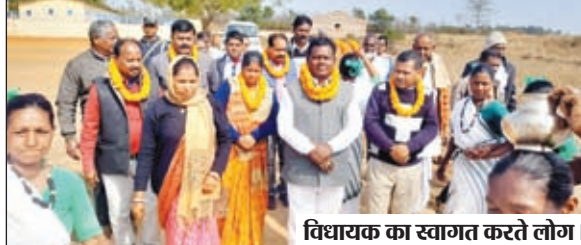
विधायक का स्वागत करते लोग।