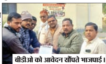
बीडीओ को आवेदन सौंपते भाजपाई।

22 जनवरी को अयोध्या में राम मंदिर के प्राण प्रतिष्ठा को लेकर बरवाडीह के सभी मंदिरों में हवन पूजन समेत अन्य धार्मिक अनुष्ठान कराए जायेंगे। जिसे देखते हुए भाजयुमो मण्डल अध्यक्ष