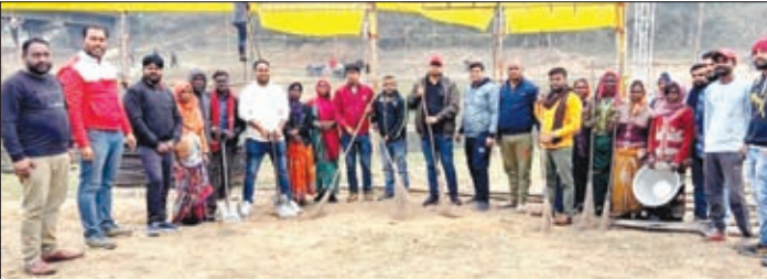
साफ-सफाई अभियान में शामिल प्रेस क्लब ऑफ जर्नलिस्ट के अध्यक्ष व अन्य।