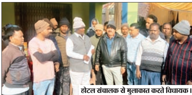
होटल संचालक से मुलाकात करते विधायक।