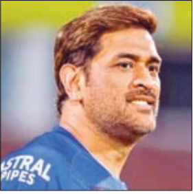
लोगों को उनके खिलाफ मानहानाी

मुकदमा दायर किया गया है। जिस पर दिल्ली हाईकोर्ट 29 जनवरी को सुनवाई करेगा। कोर्ट ने निर्देश दिया है कि इस मुकदमे की जानकारी धोनी और उनकी ओर से पैरवी कर रहे लॉ फर्म को दी जाए। दिवाकर और सौम्या ने अपनी याचिका में साल 2017 के कॉन्ट्रैक्ट के कथित उल्लंघन के संबंध में धोनी और उनकी ओर से काम करने वाले