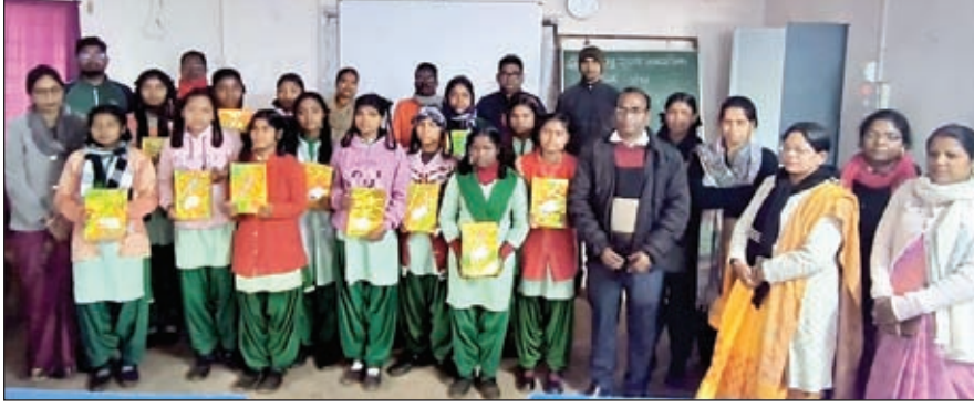
पुरस्कार के साथ प्रोजेक्ट बालिका उच्च विद्यालय की छात्राएं।