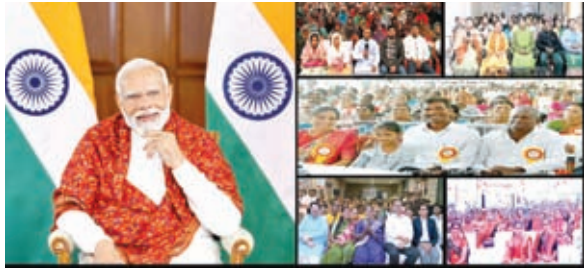
विकसित भारत संकल्प यात्रा के लाभार्थियों से बात करते प्रधानमंत्री।

विकसित भारत संकल्प यात्रा को मिल रहे प्यार और समर्थन के कारण, हमने इस अभियान को फरवरी के बाद भी जारी रखने का फैसला किया है। हमने सबसे पहले 15 नवंबर को भगवान विरसा मुंडा का आशीर्वाद लेकर यह यात्रा शुरू की थी। महज 2 महीने के अंदर यह यात्रा एक जन आंदोलन बन गई है। इस यात्रा में 15 करोड़ से ज्यादा लोग शामिल हुए हैं। विकसित भारत संकल्प यात्रा लास्ट माइल डिलीवरी का सबसे अच्छा उदाहरण है। प्रधानमंत्री ने कहा कि विकसित भारत संकल्प यात्रा के दायरे में 70 से 80 प्रतिशत पंचायतें आ चुकी हैं। प्रधानमंत्री ने देश के सभी नागरिकों को पोषण और स्वास्थ्य गारंटी प्रदान करने के अपनी सरकार के संकल्प को दोहराया। उन्होंने कहा कि हमारा प्रयास है कि हर किसी को पोषण, स्वास्थ्य और इलाज की गारंटी मिले। हर परिवार को पक्का घर