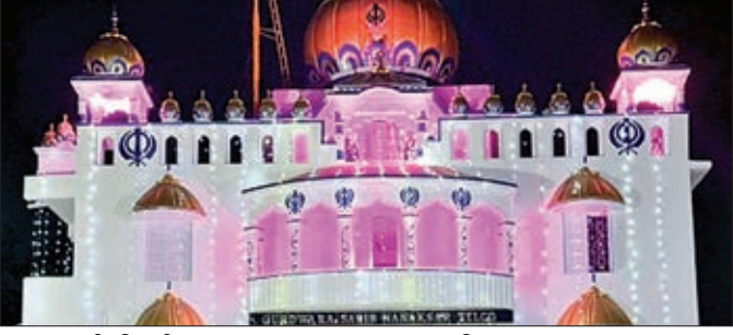
प्रकाश पर्व की पूर्व संख्या पर जगमग करता साकची गुरुद्वारा।