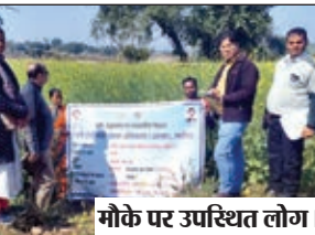
मौके पर उपस्थित लोग।