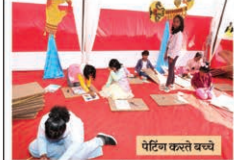
पेंटिंग करते बच्चे

चित्रकला के लिए चित्रकला में रूचि रखने वाले छात्रों के लिए केनवास और रंग उपलब्ध थे जहाँ बच्चों ने अपने अन्दर की प्रतिभा को चित्रों एवं रंगों के माध्यम से केनवास पर साकार रूप दिया।