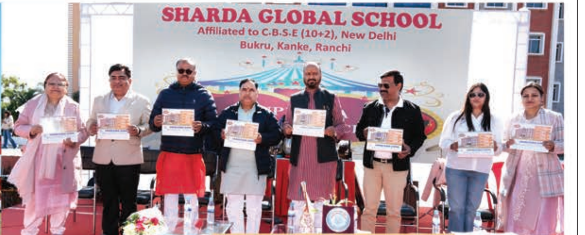
2024 का कैलेंडर जारी करते हुए अतिथिगण