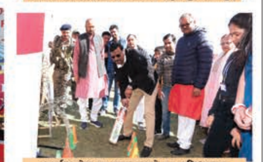
स्ट्राइक गेम का लुत्फ उठाते हुए अभिभावक