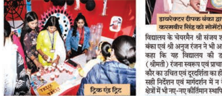
ट्रिक एंड ट्रिट

अतिथिगण ने छात्रों के सभी स्टॉल्स का भ्रमण किया तथा स्टॉल्स की सजावट एवं उनके द्वारा आयोजित स्पोर्ट्स में भाग लेकर छात्रों की प्रशंसा तथा उत्साहवर्धन किया।