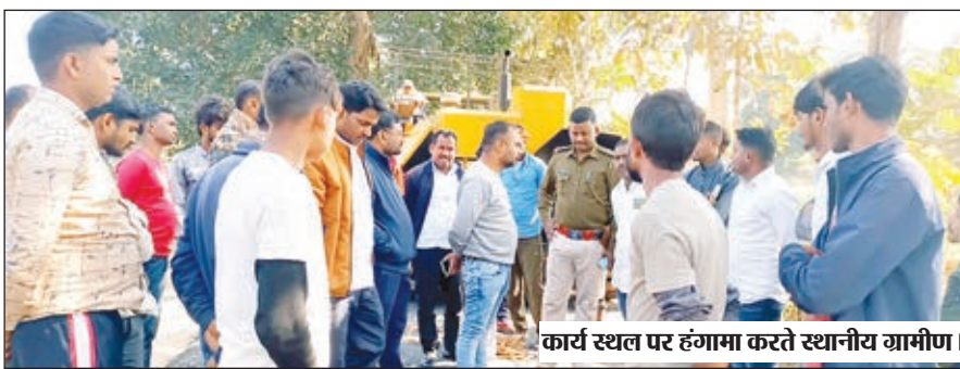
कार्य स्थल पर हंगामा करते स्थानीय ग्रामीण।

खिलवाड़ होता देख ठिकेदार को फिर से रोड को उखाड़कर दुबारा बनाने की बात कही। सभी ग्रामीण ठिकेदार की कार्यप्रणाली से काफी आक्रोशित दिखाई दे रहे थे। ग्रामीणों का कहना था कि संबंधित विभाग