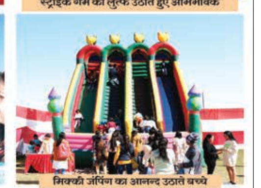
मिक्की जैपिंग का आनन्द उठाते बच्चे

ADMISSIONS OPEN - 2024-25 CLASS PRE-NURSERY TO IX AND XI HOSTEL FACILITY AVAILABLE FOR BOYS FROM CLASS 3 ONWARDS