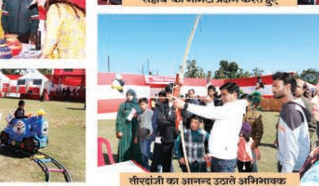
तीरन्दाजी का आनन्द उठाते अभिभावक