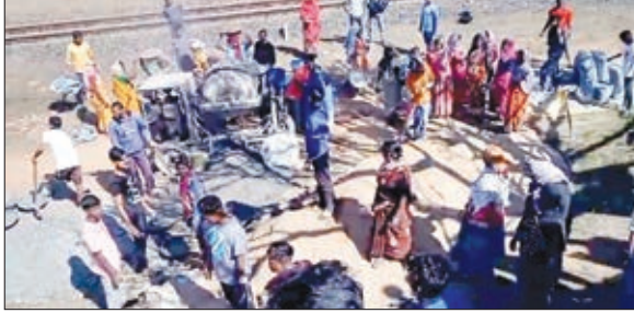
छत ढलाई कार्य में भाग लेते मुख्तियार व अन्य।