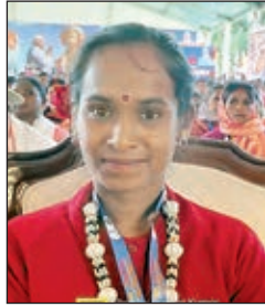
इसी महिला से पीएम नरेंद्र मोदी ने की बात।