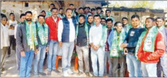
मोर्चा में शामिल हुए युवाओं के साथ जिलाध्यक्ष।