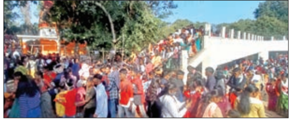
महोत्सव के दौरान उमड़ी श्रद्धालुओं की भीड़।