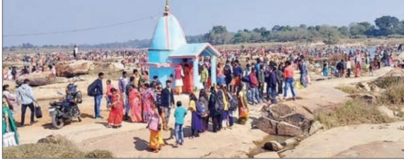
स्वर्णरेखा नदी तट पर स्नान कर पूजा करते श्रद्धालु।