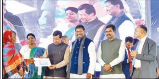
महिला को केंद्र सरकार की विभिन्न योजना का लाभ प्रदान करते इसी महिला से पीएम नरेंद्र केंद्रीय मंत्री, सांसद व अन्य।