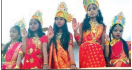
बेड़ो के खुखरा शोभायात्रा में शामिल युवतियां।