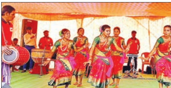
सिकितदेह में टुसू मेला में सांस्कृतिक कार्यक्रम का दृश्य।