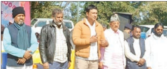
दर्शक दीर्घा में खड़े अतिथि।