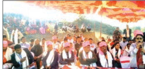
कार्यक्रम को संबोधित करते अतिथि व मौजूद अन्य।

■ मनोकामना सिद्ध बाबा भोलैनाथ मंदिर प्रांगण में मकर संक्रांति पर मेला सह सांस्कृतिक कार्यक्रम