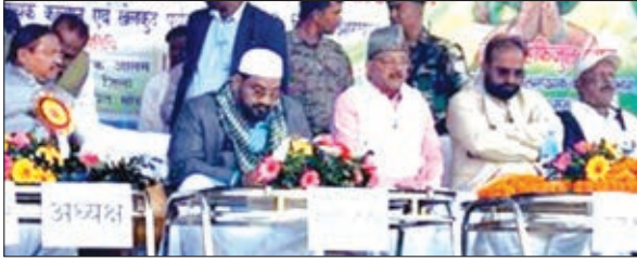
कार्यक्रम में मंचासीन अतिथि।