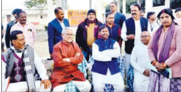
लोगों से बातचीत करते केंद्रीय मंत्री व अन्य।

लोहरदगा। विशुनपुर से रांची जाने के क्रम में केंद्रीय मंत्री अर्जुन मुंडा का गुरुकुल शांति आश्रम लोहरदगा में आयोजित कार्यक्रम में शामिल हुए। कार्यक्रम पर कई संस्थाओं ने उन्हें स्वागत किया। जिसमें सेवा भारती, भाजपा, विश्व हिंदू परिषद, आर्य वीर एवं महिला शक्ति ने भी अंग वस्त्र एवं पुष्प देकर उन्हें सम्मानित किया। केंद्रीय मंत्री अर्जुन मुंडा ने कहा कि आज हमारे देश के यशस्वी प्रधानमंत्री नरेंद्र मोदी के नेतृत्व में देश प्रकृति की ओर में बढ़ते चला जा रहा है। आज गुमला जिला के विशुनपुर में प्रधानमंत्री जी से वीडियो कॉन्फ्रेंस से सीधा संवाद