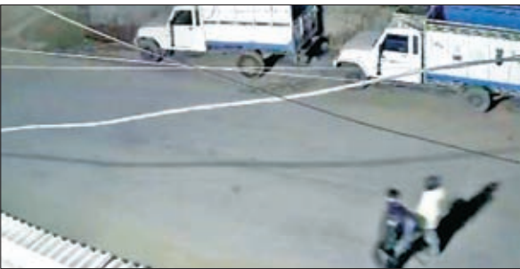
सीसीटीवी कैमरे में कैद सदिग्ध चोर ।