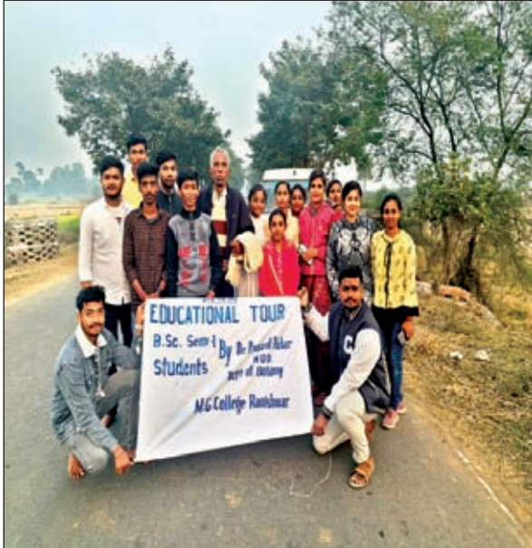
एजुकेशनल टूर में शामिल वनस्पति विज्ञान के विद्यार्थी।