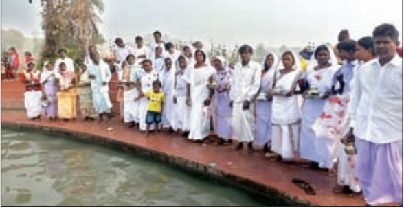
तातलोई मेला में गर्मकुंड में स्नान करते लोग।