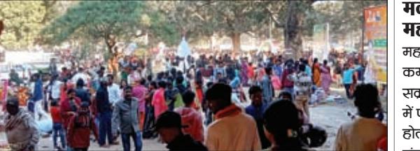
केंद्र दशन के लिए भगवान मकरध्वज की प्रतिमा को रथ में विराजमान कर परिष्कार कराया जाता है। भगवान मकरध्वज का रथ अपराह्न में खींचा गया। रथ खींचने के लिए लोगों की भीड़ उमड़ रही थी। मेला में उपस्थित भक्त भगवान के दर्शन, रथ का रस्सी खींचने व रथ को स्पर्श करने की होड़ लगी हुई थी।

मकर संक्रांति पर भगवान मकरध्वज की होती है पूजा : मकर संक्रांति के अवसर पर नागफेनी के जगन्नाथ मंदिर में भगवान मकरध्वज की विशेष पूजा अर्चना होती है। भगवान मकरध्वज की मूर्ति भी भगवान जगन्नाथ स्वामी की मंदिर में स्थापित है। मकर संक्रांति के दिन भक्तों के दर्शन पूजन के लिए भक्तों की भीड़ उमड़ पड़ी। पुरोहितों ने वैदिक मंत्रोच्चार के साथ भक्तों के फल, फूल व प्रसाद भगवान को भोग लगाया। भक्त हाथ