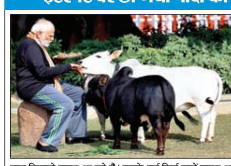
घारा खिलाले नजर आ रहे हैं। उनके हृदय गिर्द गाये नजर आ रही हैं। वे गाये पौषमओ आवास में हैं। हिंदू धर्म में गायों को भाला का दर्जा दिया गया है।

रविवार को मकर संक्रांति और पोंगल का त्योहार पर पीएम मोदी फुर्सत के पल बिताते नजर आये। पोंगल उत्सव में भाग लेने के बाद सोशल मीडिया पर पीएम मोदी की कुछ तस्वीरें सामने आयी हैं, जिसमें मोदी गायों को गुड़ और