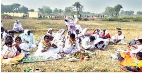
पूजा-अर्चना करते साफाहोड़ समुदाय के लोग।