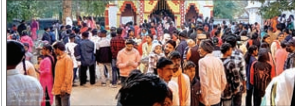
भगवान जगन्नाथ की पूजा-अर्चना करने के लिए मंदिर परिसर में लगी भीड़ और मकर संक्रांति के अवसर पर लगे मेला में पहुंचे लोग।

गुमला। गुमला और आसपास के क्षेत्रों में रविवार को मकर संक्रांति के मौके पर रथ मेला आयोजित हुआ। सिसई के नागफेनी व रायडीह प्रखंड के हीरदह में रथ मेला लगा। मकर संक्रांति पर रविवार को हजारों श्रद्धालुओं ने पवित्र नदियों व सरयवरो में आस्था की डुबकी लगायी। मंदिरों में पूजा अर्चना कर अपने घर परिवार की सुख शांति व समृद्धि के लिए भगवान से कामना की। गरीबों के बीच दान किये और तिल, गुड़, दही व चूड़ा का पारण कर मकर संक्रांति मनायी। प्राकृतिक सौंदर्य और धार्मिक आस्था का केंद्र नागफेनी में रविवार को श्रद्धालुओं ने आस्था और विश्वास के साथ कोयल नदी में स्नान किया और