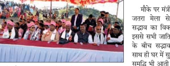
कार्यक्रम के दौरान मंच पर उपस्थित वित्त मंत्री व अन्य।

लोहरदगा। स्थानीय विधायक सह वित्त मंत्री डॉ रामेश्वर उराव ने जिले के कैरो प्रखंड के खरता में विधायक निधि से नवनिर्मित विवाह मंडप का शुभ उद्घाटन किया एवं कैरो प्रखंड के अंतर्गत खरता हनहट दक्षिणी कोयल नदी के तट पर स्थित थोलेनाथ मंदिर के समीप सद्भावना मेला का उद्घाटन किया। मौके पर मंत्री डॉ रामेश्वर उराव ने कहा कि विकास कार्यों के साथ-साथ पारंपरिक अवश्यकताओं को पूरा करना