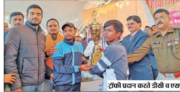
टॉपी प्रदान करते डीसी व एसपी।