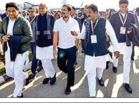
जो हुआ, वो भाजपा-आरएसएस की 'नफरत की राजनीति' का प्रतीक है। देश में एकाधिकार कायम किया जा रहा है और बड़े पैमाने पर करोड़ों बंद हो गये हैं। देश में भयंकर बेरोजगारी है।

प्रधानमंत्री का मणिपुर नहीं आना शर्मनाक राज्य में शासन का बुनियादी ढांचा विफल भारी अन्याय का सामना कर रहा देश