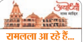
रामलला आ रहे हैं...

एजेंसी अयोध्या। रामलला की प्राणप्रतिष्ठा को अयोध्या धाम सजकर तैयार हो गया है। राम मंदिर बनकर तैयार हो रहा है। इस बीच भगवान रामलला अपने मंदिर में विराजमान होने जा रहे हैं। पूरी दुनिया उस दिन रामलला को देखने का बेसब्री से इंतजार कर रही है कि आखिर किस तरह से सजकर भगवान