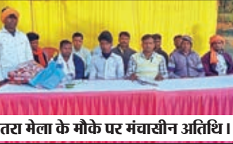
जतरा मेला के मौके पर मचासीन अतिथि ।

चंदवा। प्रखंड के माल्हेन पंचायत अंतर्गत माल्हेन पहाड़ पर स्थित शिव माल्हेनेश्वर धाम प्रांगण में मकर संक्रांति के अवसर पर रविवार को जतरा का