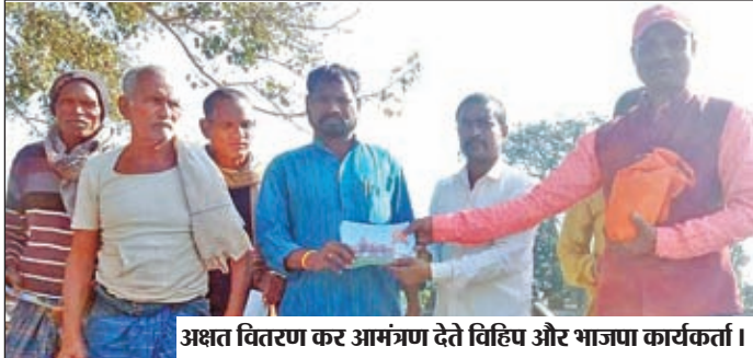
अक्षत वितरण कर आमंत्रण देते विहिप और भाजपा कार्यकर्ता ।