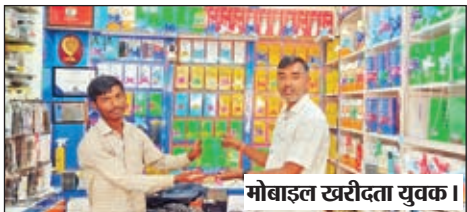
मोबाइल खरीदता युवक।