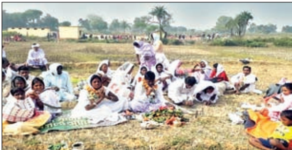
पूजा-अर्चना करते साफाहोड़ समुदाय के लोग।