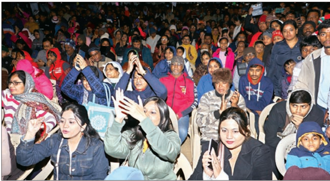
गोपाल मैदान में खवाखव भरे दर्शकों के बीच प्रस्तुति देते बॉलीवुड सिंगर अभिजीत। अभिजीत के शो के साथ तीन दिवसीय विंटर कार्निवल का भव्य समापन हो गया।