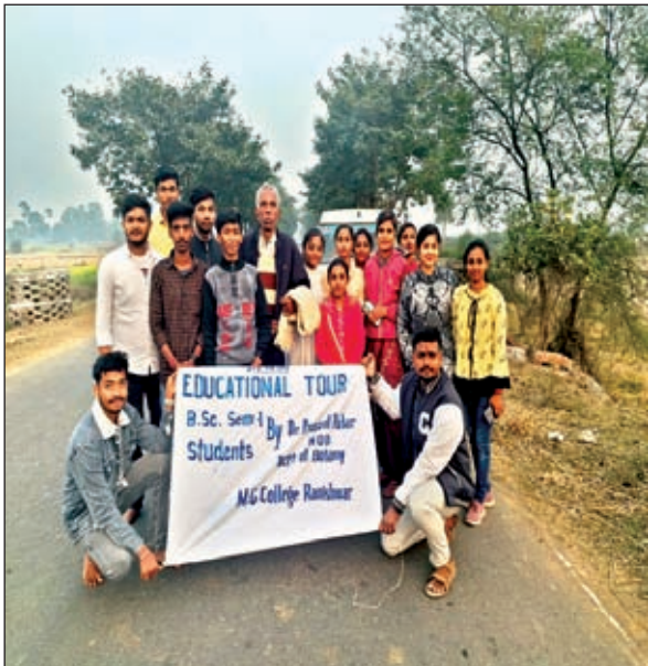
एजुकेशनल टूर में शामिल वनस्पति विज्ञान के विद्यार्थी।