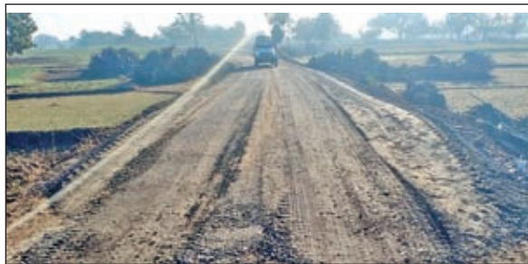
कार्यक्रम में विधायक व अन्य।