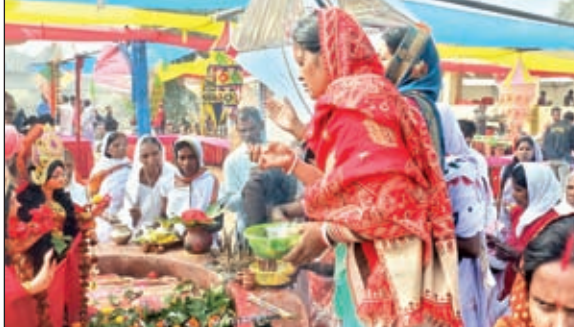
भगवान शिव व सीता-राम की पूजा-अर्चना करते साफाहोड़ व अन्य।

जामा। प्रखंड स्थित पलासी गांव में मकर संक्रांति पर आयोजित तीन दिवसीय तातलोई मेला के प्रथम दिन रविवार को हजारों भक्तों ने गर्म जलकुंड में आस्था की डूबकी लगा पूजा अर्चना कर मेले का आनंद उठाया। इस अवसर पर जामा, रामगढ़, काटीकुंड, दुमका समेत अन्य प्रखंडों से सैकड़ों साफा होड़ ने अपने-अपने धर्मगुरु के साथ तातलोई जल कुंड में डूबकी लगाने पहुंचे।