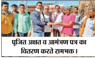
पूजित अक्षत व आमंत्रण पत्र का वितरण करते रामभक्त ।

लातेहार। सदर प्रखंड के पांडेयपुर पंचायत के सभी ग्रामों में अयोध्या में नवनिर्माण रामलाल की मंदिर में प्राण प्रतिष्ठा कार्यक्रम को लेकर अयोध्या से आए पूजित अक्षत एवं आमंत्रण पत्र के साथ