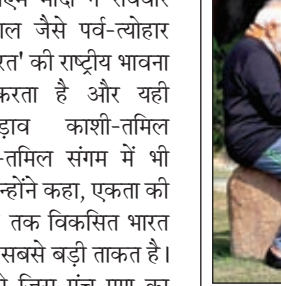
चारा खिलाते नजर आ रहे हैं। उनके हृदय गिर्द गायें नजर आ रही हैं। ये गायें पीएमओ आवास में हैं। हिंदू धर्म में गायों को गलत का दर्जा दिया गया है।

रविवार को मकर संक्रांति और पोंगल का त्योहार पर पीएम मोदी फुर्सत के पल बिताने नजर आये। पोंगल उत्सव में भाग लेने के बाद सोशल मीडिया पर पीएम मोदी की कुछ तस्वीरें सामने आयी हैं, जिसमें मोदी गायों को गुड़ और चारा खिलाते नजर आ रहे हैं। उनके हृदय गिर्द गायें नजर आ रही हैं। ये गायें पीएमओ आवास में हैं। हिंदू धर्म में गायों को गलत का दर्जा दिया गया है।