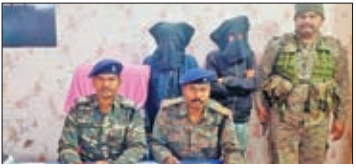
गिरफ्तार अफीम तस्कर व जानकारी देती पुलिस ।

बालूमाथ थाना पुलिस ने चार किलो अफीम के दो तस्करों को गिरफ्तार करने में