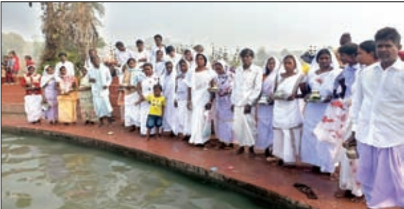
तातलोई मेला में गर्मकुंड में स्नान करते लोग।