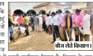
बीज लेते किसान।

लातेहार। प्रखंड कार्यालय परिसर में कृषि विभाग के द्वारा मंगलवार को गेहूं बीज का वितरण किसानों को लेकर 5 दिनों से टोरी साइडिंग में कांटा कार्य बाधित कर आंदोलन पर है। लगातार 5 दिनों से कांटा कार्य बंद होने के बाद टोरी साइडिंग में कामकाज को लेकर 5 दिनों से टोरी साइडिंग में कांटा कार्य को बंद कर दिए जाने के बाद हिंडालको टोरी अनलोडिंग स्टेशन में बाँकसाइट लोडिंग व अनलोडिंग कार्य में लगे लगभग एक हजार मजदूरों के समक्ष रोजी रोटी पर आफत मंडराने लगा है। 5 दिनों से कांटा बाधित होने के कारण एक भी ट्रक अनलोडिंग नहीं हो पाया है और न ही एक भी रैक लोड हुआ, जिसके कारण हिंडालको से जुड़े दैनिक भोगी मजदूर परेशान है। मंगलवार को काफी संख्या में लोडिंग व अनलोडिंग मजदूर साइडिंग परिसर पहुंच कर आंदोलन कर रहे ट्रक ऑनरों से आंदोलन को समाप्त करने का