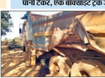
बम विस्फोट से फटा हाइवा वाहन का बॉडी।