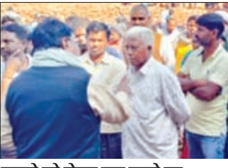
मामले को लेकर बात करते हुए