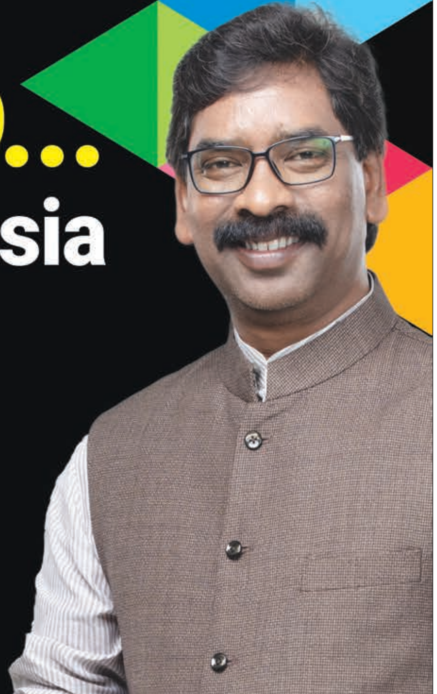
HEMANT SOREN Chief Minister, Jharkhand

JHARKHAND... After Conquering Asia Now Ready to Embrace the World