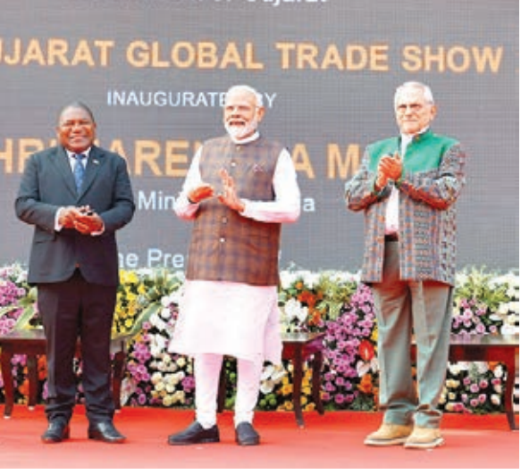
गुजरात और आत्मनिर्भर भारत सहित विभिन्न थीमों पर आधारित 13 प्रदर्शनी हॉल बने हैं। इस ग्लोबल ट्रेड शो में 100 देश,

आत्मनिर्भर भारत सहित विभिन्न थीमों पर आधारित बने हैं 13 प्रदर्शनी हॉल