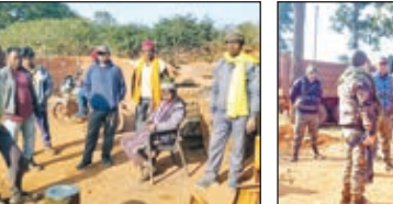
घटना के बाद भयभीत मजदूर व अन्य और मौके पर पहुंची पुलिस।

जले हुए कई वाहनों को हटाया गया : पत्रकारों के पहुंचने के पहले कई वाहनों को कंपनी और पुलिस वालों ने हटाना शुरू कर दिया था। लेकिन जैसे ही पत्रकार पहुंचे, सब कुछ वैसी ही छोड़ दिया। घटनास्थल से कई वाहन हटा दिये गये थे। दबी जुबान में मजदूरों ने बताया कि कुछ वाहनों को यहां से हटाया गया है। जब पत्रकारों ने अगल-बगल देखा तो झाड़ी के पीछे एक हाइवा छुपा कर रखा था। जो पूरी तरह जला हुआ था।