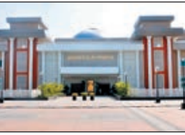
2022 के जून महीने में अदालत ने दोनो पक्षों को सुनाने के बाद अपना फैसला सुरक्षित रख लिया था।

पांच साल बाद फिर सक्रिय : इलाके में करीब पांच साल तक से शांत बैठे नक्सली फिर सक्रिय हो गये हैं। पुराना पुलिस पिकेट सतकोनवा में खड़ी एक दर्जन वाहनों को आग के हवाले कर दिया। घटनास्थल से मिली जानकारी के अनुसार रात करीब एक से दो बजे के बीच नक्सली पहुंचे। उस वक्त चार मजदूर पुराना पुलिस पिकेट में सो रहे थे। नक्सलियों ने उन मजदूरों को उठाया। डीजल मांगकर सभी गाड़ियों में आग लगा दी। मजदूरों को पर्चा देते हुए माइंस क्षेत्र में काम बंद रखने की धमकी दी है। आग लगाने के बाद नक्सली निकल गये। करीब 6-7 की संख्या में आये नक्सलियों ने करीब आधे घंटे तक उत्पात मचाया।