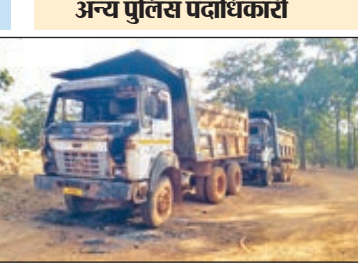
नक्सलियों के द्वारा फूँके गये वाहन।