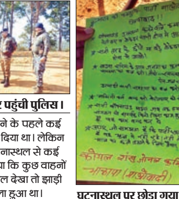
घटनास्थल पर छोड़ा गया पत्र।

जले हुए कई वाहनों को हटाया गया : पत्रकारों के पहुंचने के पहले कई वाहनों को कंपनी और पुलिस वालों ने हटाना शुरू कर दिया था। लेकिन जैसे ही पत्रकार पहुंचे, सब कुछ वैसी ही छोड़ दिया। घटनास्थल से कई वाहन हटा दिये गये थे। दबी जुबान में मजदूरों ने बताया कि कुछ वाहनों को यहां से हटाया गया है। जब पत्रकारों ने अगल-बगल देखा तो झाड़ी के पीछे एक हाइवा छुपा कर रखा था। जो पूरी तरह जला हुआ था।