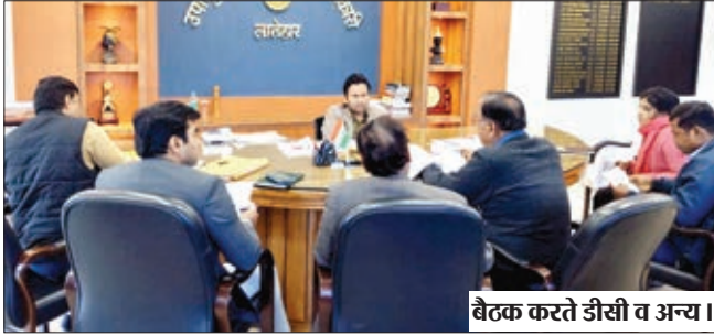
बैठक करते डीसी व अन्य।

एवं गंभीरता के साथ कार्य करना है। उपायुक्त ने सिविल सर्जन से नवजात बच्चों में लिंगानुपात के बारे जानकारी लिया। सिविल सर्जन ने बताया कि माह अप्रैल 2023 से माह दिसंबर 2023 तक लातेहार जिले में जन्मे बच्चों का लिंग अनुपात 926 है। उपायुक्त लातेहार ने सिविल सर्जन को जिले में संचालित अल्ट्रासाउंड जांच केंद्रों में औचक जांच कर पीसीपीएनडीटी एक्ट का उल्लंघन पाये जाने पर नियमानुसार कारवाई करने