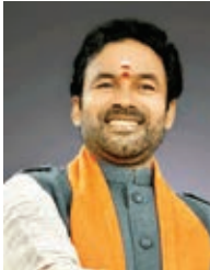
जी किशन रेड्डी

रेजोल्यूशन पंजीवित एनर्जी लेकर आना चाहिए। अधूरे रेजोल्यूशन के नाम से निराश नहीं होना चाहिए। सफलता और असफलता में एक छोटा-सा अंतर होता है- कि अपना लक्ष्य कैसे तय किया और उसे प्राप्त करने को क्या तरीका अपनाया। जरूरी है विमन, लोचशील और हठान्न जजमेंटल एटीट्यूड अपनाकर रेजोल्यूशन को फॉलो करें- उसमें आपको निश्चय ही सफलता मिलेगी।