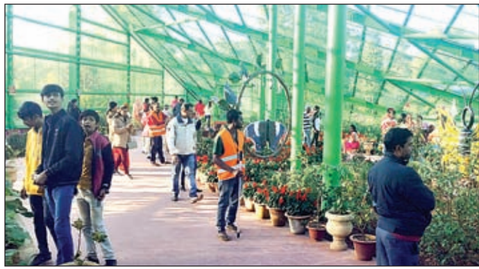
पार्क में तितली नहीं मिली, तो फूलों का लुक उठाते पर्यटक।

ओरमांडी। नववर्ष पर बिरसा जैविक उद्यान, रूक्का डैम सहित सभी पिकनिक स्थलों पर पर्यटकों की भीड़ देखी जा रही है। कई परिवार यहां जैविक उद्यान में तितली पार्क का अवलोकन करने पहुंच रहे हैं, लेकिन यहां तितलियां नहीं देखकर अपने आप को ठगे महसूस कर रहे हैं। जैविक उद्यान के तितली पार्क में टिकट लेकर पहुंचे सैलानी, लेकिन पार्क में