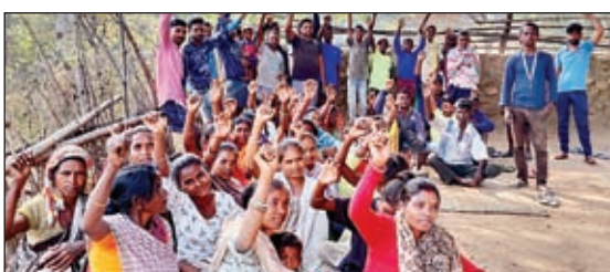
खबर मन्त्र संवाददाता

अनगड़ा। बुनियादी सुविधाओं की मांग को लेकर मौजा सिलवे के उल्लाटू पाहन टोली शीशीपीड़ी भुआल टोली आदि गांव के ग्रामीणों ने बैठक कर आंदोलन करने तथा वोट बहिष्कार करने की चेतावनी दी है। ग्रामीणों ने बताया कि उक्त गांव-टोलों में बुनियादी सुविधाओं का घोर अभाव है। रांची-पुरलिया सड़क से मात्र डेढ़ किलोमीटर की दूरी पर उक्त गांव और टोले अवस्थित है। इन गांव टोलों में जाने वाली सड़क की हालत बेहद खराब है। सड़क पर सैकड़ों गड्ढे हो गए हैं। रांची पुरलिया सड़क के मिलन चौक