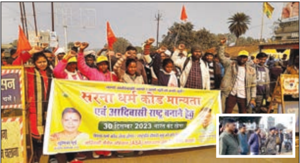
जाम करते आदिवासी सेंगेल अभियान व वाहनों की लगी लंबी कतार