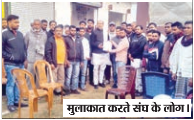
मुलाकात करते संघ के लोग।