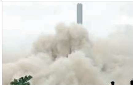
गिरता हुआ चिमनी।

● उच्च स्तर पर रहा अपराध का ग्राफ, अभिजीत प्लांट से चोरी व 10 वर्षीय छात्रा के साथ गैंग रेप, डायन भूत के शक में वृद्ध दम्पति की हत्या बना राज्यस्तर पर सुखियां