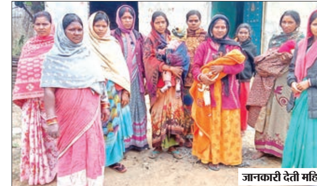
जानकारी देती महिलाएं।

● जन्म प्रमाण पत्र के लिए भी पैसे की मांग, बच्चों का नहीं बना आधार कार्ड, शिक्षा से वंचित