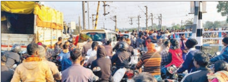
फाटक पर लगा जाम।