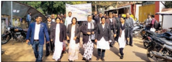
मांगों को लेकर मौन जुलूस निकालते अधिवक्ता संघ