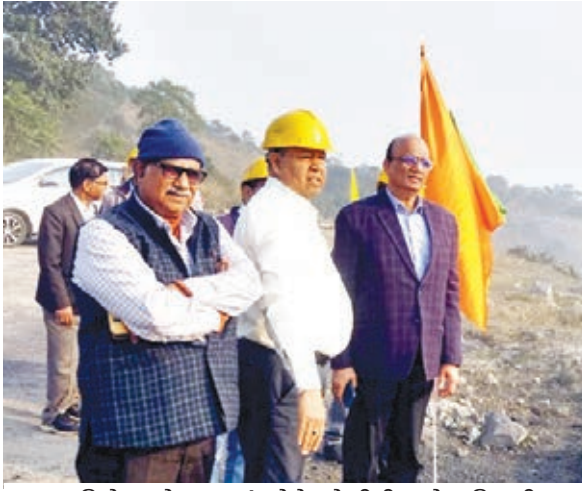
करमा परियोजना के व्यू प्वाइंट से देखते सीसीएल के अधिकारी।