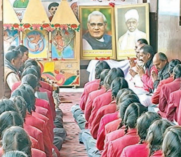
अतिरिक्त युग के आदर्श पुरुष भी थे। वे भारत के पहले और अन्तिम व्यक्ति थे जिन्हें महामना की सम्मानजनक उपाधि से विभूषित किया गया।