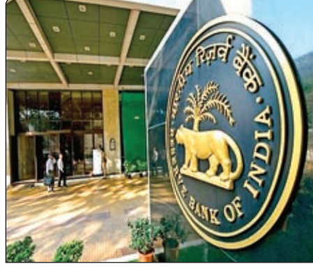
एमआरए मार्ग पुलिस स्टेशन ने मामला दर्ज करके छानबीन शुरू कर दी है। मुंबई

मुंबई। मुंबई स्थित भारतीय रिजर्व बैंक (आरबीआइ), एचडीएफसी और आईसीआईसीआई समेत कई बैंकों को बम से उड़ाने की धमकी दी गयी है। इमेल के जरिये दी गयी धमकी में कहा गया है कि आरबीआइ गवर्नर शक्तिकांत दास और वित्त मंत्री निर्मला सीतारमण अपने पद से इस्तीफा दे दें। धमकी भरे इमेल में कहा गया है कि 11 जगहों पर बम लगाये गये हैं। धमकी मिलने के बाद पुलिस ने तलाशी अभियान चलाया, हालांकि कहीं से कोई संदिग्ध सामग्री नहीं मिली है।