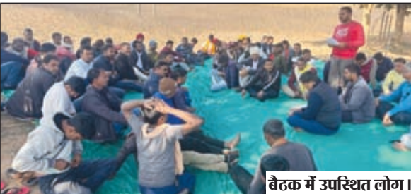
बैठक में उपस्थित लोग।

अनलॉडिंग राशि अधिकतम 800 होगा। डीओ का 25% कोयला उठाव होने के बाद ट्रक मालिकों का भाड़ा भुगतान करना होगा। भाड़ा चिट्ठी में ट्रांसपोर्टिंग फर्म का जीएसटी नंबर, निर्धारित भाड़ा, अनलॉडिंग की राशि अंकित करना अनिवार्य है। भाड़ा का चालान जमा करने समय निर्धारण भाड़ा के हिसाब से रिसीविंग देना तय किया गया था। लेकिन कुछ डीओ के लिफ्टर द्वारा इन सभी नियमों को नहीं मानते हुए भाड़ा तोड़ने के नियत से शनिवार की शाम जबरन बालूमाथ एवं बसिया की लिफ्ट की कुछ गाड़ियां समेत बाहर की गाड़ियां मंगा कर जबरन ट्रकों का