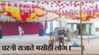
चरनी सजाते मसीही लोग।