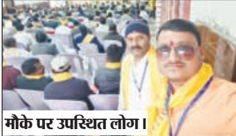
मौके पर उपस्थित लोग।

बारियातू। झारखंड प्रजापति (कुंहार) महासंघ का एक दिवसीय कार्यक्रम कुम्हार महासभा में शामिल होने के लिए बारियातू से रांची के लिए दर्जनों लोग सुरक्षित वाहन से रवाना हुए।