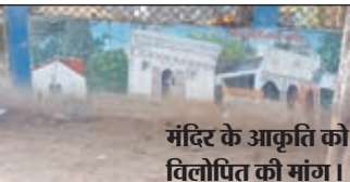
मंदिर के आकृति को विलोपित की मांग।