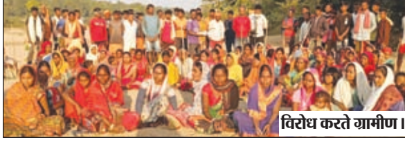
विरोध करते ग्रामीण।

चंदवा। कोयला, खनिज संपदा व पानी आदि की खोज को लेकर कोयला मंत्रालय के तहत (सेटल माईंस प्लानिंग एंड डिजाइन इंस्टीट्यूट लिमिटेड (सीएमपीडीआइ) कंपनी के द्वारा प्रखंड के मालहन पंचायत अंतर्गत केकराही, सेकंतेरी, चटहर, केंदुआ टांड व अन्य गांवों में किए जा रहे उडी भूकंपीय और प्रतिरोधकता सर्वेक्षण का विरोध ग्रामीणों के द्वारा लगातार किया जा रहा है। इसी कड़ी में रविवार ग्रामीणों ने रविवार को सर्वे करने आये लोगों को रोक दिया। जिसके बाद ग्रामीणों ने बैठक सीएमपीडीआइ केकराही में किये जा रहे सर्वेक्षण को लेकर गंधीरता से चर्चा किया। ग्रामीणों ने कहा कि पूर्व में सीएमपीडीआइ के प्रबंधक व वरीय अधिकारियों के साथ सामूहिक संवाद कार्यक्रम हुआ था, जिसमे साफ तौर पर कहा गया था कि अनुसूचित क्षेत्र में बिना ग्राम सभा के अनुमति के कोई कार्य नहीं किया जाए, जिसके बाद सर्वे का काम बंद था, लेकिन सीएमपीडीआइ के द्वारा पुनः सर्वे का काम किया जा रहा है। ग्रामीणों ने बैठक में सर्वसम्मति से यह निर्णय लिया कि यहां के शत-प्रतिशत आबादी के जीवकोपार्जन का माध्यम कृषि है। इसी के भरोसे परिवार का भरण पोषण चलता है। इसीलिए हमसभी ग्रामीण सर्वे का विरोध करेंगे। जब तक ग्रामीणों की बातों पर विचार नहीं किया जाएगा तब तक किसी प्रकार के सर्वे कार्यों को बंद करने का मांग ग्रामीणों ने किया है। मौके पर सीएमपीडीआइ के अधिकारी समेत काफी संख्या ग्रामीण मौजूद थे।