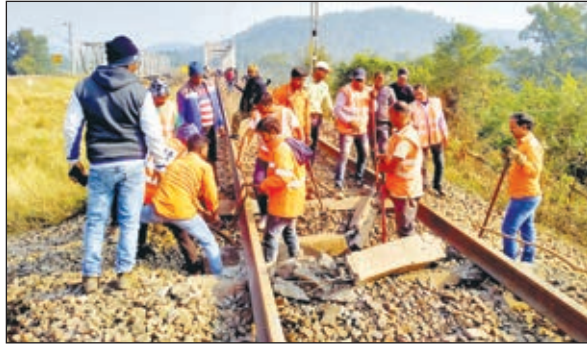
क्षतिग्रस्त रेल पट्टी की मरम्मत करते रेलकर्मी।