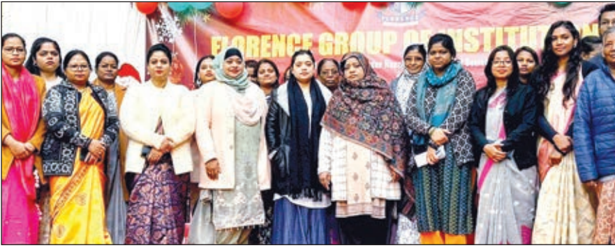
कार्यक्रम के दौरान छात्राओं के साथ उपस्थित निदेशक।