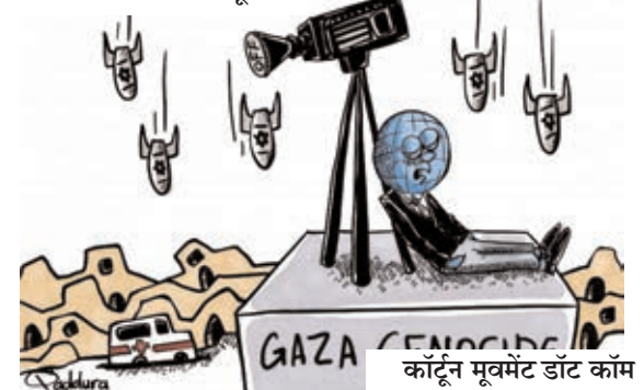
कार्टून मूवमेंट डॉट कॉम