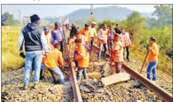
क्षतिग्रस्त रेल पट्टी की मरम्मत करते रेलकर्मी।