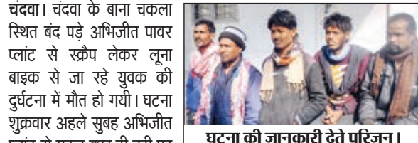
घटना की जानकारी देते परिजन।