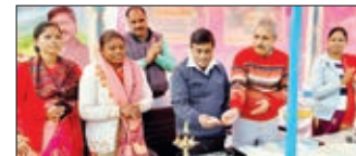
शिविर का उद्घाटन करते अतिथि।

चंदवा। राज्य सरकार द्वारा संचालित जनकल्याणकारी योजनाओं का लाभ मांग के अंतिम व्यक्ति तक पहुंचे, इस उद्देश्य के साथ हेमंत सोरेन सरकार द्वारा चलायी जा रही आपकी योजना