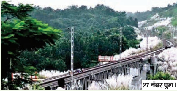
27 नंबर पुल।

झारखंड के दूसरे सबसे ऊंचे रेलवे पुल के निर्माण के समय किसी ने नहीं सोचा होगा कि यह स्थान पर्यटकों की पहली पसंद बन जाएगा। सचमुच अपने नाम की तरह मुगलदाहा नदी और आसपास की सुंदरता मुगलों की शान लिए हुए है। एक समय नक्सलियों के लिए गढ़ माने जाने वाली जगह में आज प्रतिदिन करे हजारों की संख्या में पर्यटक आ रहे हैं। यह सिलसिला लगातार बढ़ता ही जा रहा है। देखा जाए तो बरसात के दिनों को छोड़कर पूरे वर्ष यहां लोग पहुंच रहे हैं। सुरक्षा के दृष्टिकोण से यह जगह अब सुरक्षित है क्योंकि यहां पिकेट भी स्थापित है।