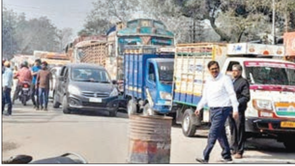
दुकानदारों ने कहा कि दो विधायकों की अनुशंसा पर झरिया विधानसभा के डिनेबली मोड़ से सिंदरी विधानसभा के सरिसाकुड़ी तक सड़क का पुनरुद्धार व नाली निर्माण कार्य किया जा रहा है। इस कार्य को कर रही मेसर्स दरोगा प्रधान कंपनी बिना किसी अभियंता के सड़क निर्माण कर रही है। इस निर्माण के दौरान बिछाए गए रोड़ों से प्रतिदिन प्रदूषण फैल रहा है। उड़ती धूल से खाद्य पदार्थ बर्बाद हो रहे हैं। लोगों के स्वास्थ्य पर बुरा असर पड़ रहा है। अस्थमा ग्रस्त लोगों का सड़क के पास से गुजरना जानलेवा साबित हो रहा है। उन्होंने माँग की है कि प्रतिदिन सड़क पर पानी का छिड़काव किया जाए, ताकि लोग भयावह प्रदूषण की मार से बच सकें। उन्होंने बताया कि

नाली निर्माण के दौरान कंपनी की जेसीबी मशीन ने दूरसंचार विभाग सहित बिजली विभाग के तारों को काट दिया है। इससे स्थानीय लोगों को परेशानी का सबब झेलना पड़ रहा है। सूचना पर पहुँची गौशाला ओपी पुलिस ने लोगों से बातचीत की और झरिया सीओ से दूरभाष पर वार्ता की गई। झरिया सीओ द्वारा आश्वासन के बाद लोगों ने सड़क जाम हटाया। संवेदक दरोगा प्रधान ने बताया कि प्रतिदिन सड़क पर पानी का छिड़काव किया जाएगा। इससे लोगों को प्रदूषण से राहत मिलेगी।