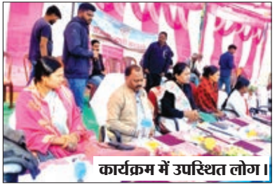
कार्यक्रम में उपस्थित लोग।