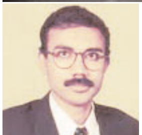
प्रो अनल कुमार सूरज सिंह मेमोरियल कॉलेज रांची

हंगर इंडेक्स 2023 की रिपोर्ट वर्ष 2023 के ग्लोबल हंगर इंडेक्स की लिस्ट जारी हुई है। इस लिस्ट में भारत को न सिर्फ 125 देशों में से 111वां स्थान मिला है। बल्कि 287 स्कोर के साथ भारत में भूखमरी की स्थिति को गंभीर भी बताया गया है। लिस्ट के अनुसार भारत की हालत अपने पड़ोसी देश पाकिस्तान, श्रीलंका, नेपाल और बांग्लादेश से भी बदतर है। दरअसल हंगर इंडेक्स की लिस्ट में पाकिस्तान को 102, बांग्लादेश की