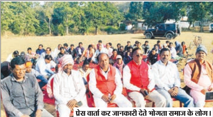
प्रेस वार्ता कर जानकारी देते भोगता समाज के लोग।