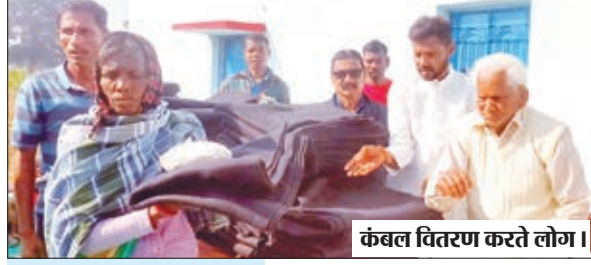
कंबल वितरण करते लोग।