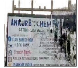
शराब बनाने वाली कंपनी अंकुर बायोकेम तेतुलिया स्थित कारखाने में पहुंची और जांच शुरू किया। आईटी के टीम के अंदर जाने के बाद से किसी को भी अंदर जाने या अंदर से बाहर

धनबाद। बुधवार की अहले सुबह धनबाद में आईटी की टीम ने दबिशा दी है। शराब निर्माण कंपनी अंकुर बायोकेम के कारखाने पर इनकम टैक्स की टीम ने छापेमारी की है। आईटी की टीम वहां कागजातों को खंगला रही है। बताते चले कि धनबाद और पश्चिम बंगाल के कोलकाता और आसनसोल की आयकर टीमों ने एक साथ निरसा के तेतुलिया स्थित शराब निर्माण कंपनी अंकुर बायोकेम में दस्तक दी है। धनबाद और कोलकाता आयकर की विशेष टीम एक साथ संयुक्त रूप से