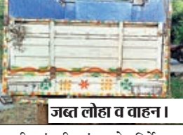
जब्त लोहा व वाहन।