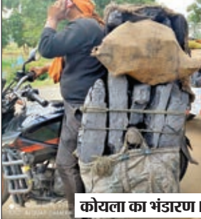
कोयला का भंडारण।

बारियातू। बारिखाप स्थित केसीपी मुख्यमार्ग के ठीक सामने ब्युडैम जाने के रोड में कोयले भंडारण कर रात्रि में लॉडर मशीन से लॉड कर पिछले कई दिनों से कोयले की काला खेल किया जा रहा है। इधर टोटी मनातू मार्ग के बनवार पंकरुवा के बीच हनुमान चौकी से 100 मीटर दक्षिण दिशा में जैसीबी द्वारा जंगल साफ कर कोयले भंडारण के लिए स्थल बनाकर कोयले की तस्करी करवाया जा रहा है। बारिखाप स्थित केसीपी ब्यु पानीडेम के पास कोयला भंडारण कर लॉडर मशीन के सहारे रात्रि में कई बड़े वाहन में लॉडिंग कर एनएच 99 मुख्यमार्ग से से कोयला बाहर भेजकर तस्करी किया जा रहा है। सूत्रों से मिली जानकारी के मुताबिक