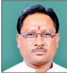
विष्णुदेव सोय छत्तीसगढ़ के नए सीएम

स्पीकर के लिए मनोनित रमन सिंह को भी दी बधाई