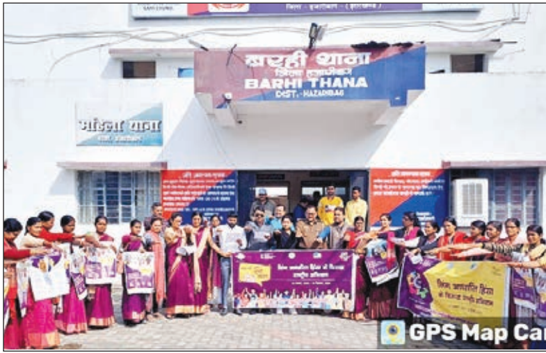
बरही थाना में शनिवार को शपथ लेती महिलाएं।