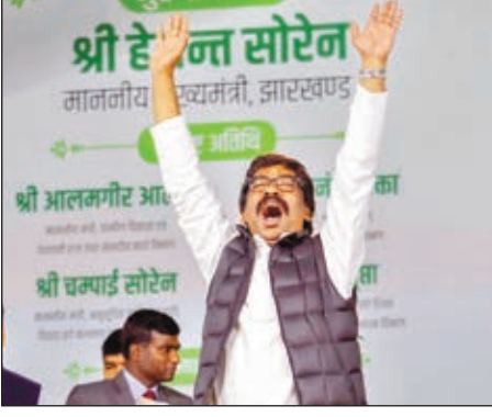
मानपुर पंचायत में उपस्थित जन समुदाय के झारखंडी जोहार का मुख्यमंत्री जवाब देते हुए।

उन्होंने कहा- यह एक महाअभियान है, जिसके माध्यम से आपको पूरे मान-सम्मान के साथ आपका अधिकार देने सरकार आपके दरवाजे पर पहुंच रही है।