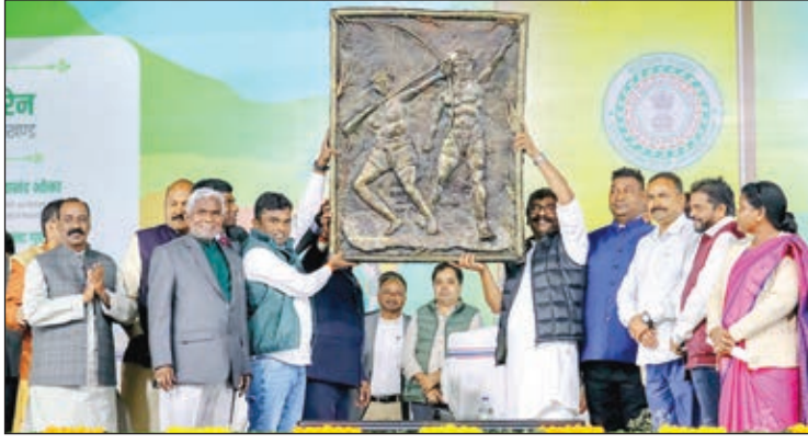
लाभुकों के बीच परिसंपत्ति बांटे मुख्यमंत्री और मंत्रीगण।

मुख्यमंत्री ने कहा कि राज्य के सभी पंचायतों में 'आपकी योजना-आपकी सरकार-आपके द्वार' कार्यक्रम के तहत शिविर लग रहे हैं। इन शिविरों को लेकर ग्रामीणों का उत्साह देखते ही बन रहा है।