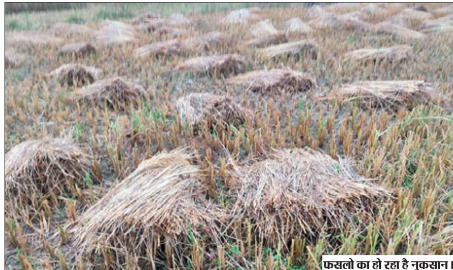
फसलों का हो रहा है नुकसान।

लातेहार। लातेहार जिले में पिछले दो दिनों से हो रही बेमौसम लगातार बारिश ने जिले के जनजीवन को पूरी तरह अस्त-व्यस्त कर दिया है। गौरतलब है कि चक्रवाती तूफान मिचौंग ने देश के कई राज्यों में कहर बरपाया है। जिसका व्यापक असर पूरे झारखण्ड राज्य के साथ साथ पूरे लातेहार जिले में भी देखा जा रहा है। लगातार बारिश से जिले की नदियां व नहरें पूरी तरह उफान पर हैं। गलियों में जलजमाव हो गया है। बरसात देख कर ऐसा लग रहा है कि दिसंबर माह में सावन भादो की स्थिति हो गई है। जहां पिछले 48 घंटे से अधिक समय से पूरे जिले में झमाझम बारिश हो रही है। दो दिनों से लोगों को सूर्य भगवान