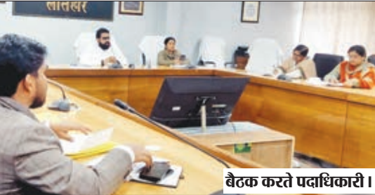
बैठक करते पदाधिकारी।