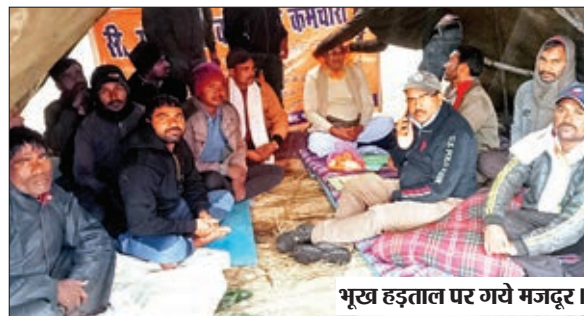
भूख हड़ताल पर गये मजदूर।