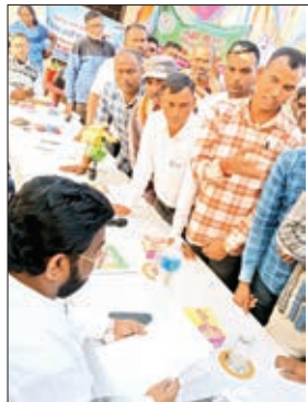
विधायक को आवेदन सौंपते ग्रामीण।