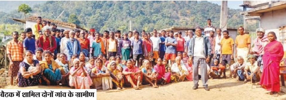
बैठक में शामिल दोनों गांव के ग्रामीण

घाघरा। घाघरा प्रखंड के जिलिंगसिरा गांव के ग्रामीणों ने गुरुवार को गांव में जर्जर सड़क को लेकर बैठक किया। बैठक में ग्रामीणों ने एक स्वर में नारा लगाया है कि रोड नहीं तो वोट नहीं। ग्रामीणों ने आगामी लोकसभा व विधानसभा चुनाव का बहिष्कार करने का निर्णय लिया। ग्रामीणों ने बताया कि 70 साल से वे बदहाली में जीवन