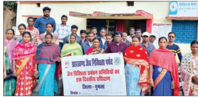
प्रशिक्षण के बाद जैव विविधता समिति के सदस्य

गुमला। हेल्लिंग हैंड फाउंडेशन रांची के द्वारा घाघरा प्रखंड के सभी 18 पंचायतों में जैव विविधता सभियों की सुस्क्षा तथा स्तरीय कमेटियों का प्रशिक्षण सफलता पूर्वक संपन्न हुआ। गुरुवार को पंचायत सचिवालय घाघरा में प्रशिक्षण दिया गया। जिसमे बिमरला पंचायत,रुकी पंचायत, कुर्गाँव पंचायत, आदर पंचायत, के चयनित प्रतिनिधि भाग लिया। झारखंड में वन संरक्षण, जंगली व पालतू जानवर एवं पेड़ पौधों सहित सूक्ष्म जंतु के जीवन की सुरक्षा तथा विकास को लेकर योजना तैयार कर उसके क्रियान्वयन का अधिकार पंचायत स्तर पर बनी जैव विविधता समिति को हासिल है। इन समितियों के कार्य और उत्तरदायित्व चर्चा समुचित क्रियान्वयन को लेकर पंचायत कमेटी सदस्यों को प्रशिक्षण दिया जा रहा है।