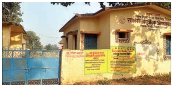
आयुष हेल्थ एंड वेलनेस सेंटर