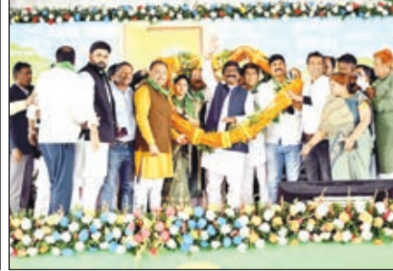
शिलान्यास करते मुख्यमंत्री, कार्यक्रम का उद्घाटन करते मुख्यमंत्री व मुख्यमंत्री का स्वागत करते लोग