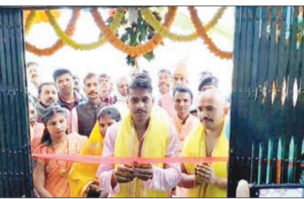
उद्घाटन करते थाना प्रभारी