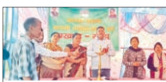
विकास शिविर का उद्घाटन करते जिए सदस्य व अन्य।

सरयु। नवनिर्मित सरयु प्रखंड के गनेशपुर पंचायत भवन के प्रांगण में बुधवार को आपकी योजना आपकी सरकार आपके द्वार कार्यक्रम का आयोजन किया गया। इस कार्यक्रम का