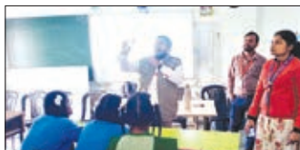
जानकारी देते पदाधिकारी।

चंदवा। प्रखंड के अंतर्गत कस्तूरबा गांधी स्कूल चंदवा में जिला यक्षमा पदाधिकारी लातेहार के निदेशानुसार टीबी रोग से बचाव के प्रति छात्राओं को जागरूक किया गया। टीबी बीमारी को लेकर