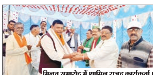
मिलन समारोह में शामिल राजद कार्यकर्ता।