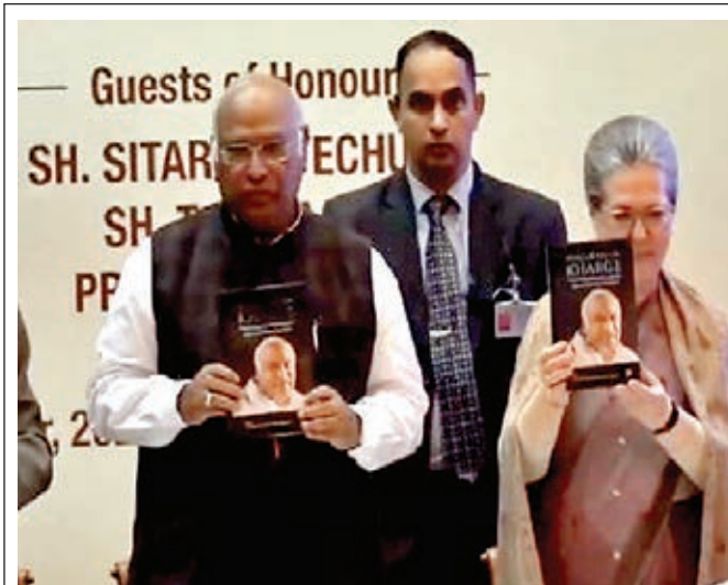
चुनावी राजनीति में कांग्रेस के राष्ट्रीय अध्यक्ष मल्लिकार्जुन खड़गे के 50 साल पूरे होने के सम्मान में बुधवार को नयी दिल्ली स्थित जवाहर भवन में आयोजित सम्मान समारोह के मौके पर कांग्रेस की पूर्व अध्यक्ष सोनिया गांधी ने उन पर लिखी पुस्तक मल्लिकार्जुन खड़गे: पॉलिटिकल एंजेंजमेंट विद कम्पैशन, जस्टिस एंड इनक्लूसिव डेवलपमेंट का विमोचन किया।

प्रतिशत चढ़कर 20,096.60 अंक पर बंद हुआ। संसेक्स की कंपनियों में एक्सिस बैंक, महिंद्रा एंड महिंद्रा, विप्रो, टाटा मोटर्स, एचडीएफसी बैंक, टेक महिंद्रा, आईसीआईसीआई बैंक, जेएसडब्ल्यू स्टील, टाटा कंसल्टेंसी सर्विसेज, इंफोसिस, एचसीएल टेक्नोलॉजीज और भारती एयरटेल में उल्लेखनीय बढ़त दर्ज की गई। दूसरी ओर नेस्ले, टाइटन, बजाज फिनसर्व और अल्ट्राटेक सीमेंट के शेयरों में गिरावट रही। अन्य एशियाई बाजारों में दक्षिण कोरिया का कॉस्पी, चीन का शंघाई कंपोजिट, जापान का निक्की और हांगकांग का हैंगसेंग गिरावट के साथ बंद हुए।