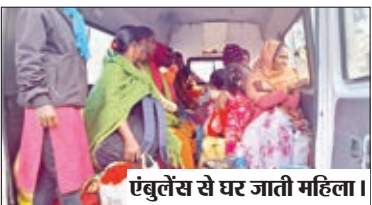
एंबुलेंस से घर जाती महिला।

चंदवा। सामुदायिक स्वास्थ्य केंद्र परिसर में बंधाकरण के बाद 8 महिलाओं व परिजनों को एक ही एंबुलेंस में भरकर घर भेजने का मामला प्रकाश में आया है। एंबुलेंस में वैसी महिलाएं जिनका ऑपरेशन किया गया था, उनके अलावे उनके परिजन एवं सहिया साथी को भी भरकर पशुओं की तरह भेज दिया गया। मामला मंगलवार बताया जा रहा है। बताते चलें कि इन दिनों परिवार नियोजन कार्यक्रम के तहत सामुदायिक स्वास्थ्य केंद्र परिसर में बंधाकरण एवं नसबंदी कार्यक्रम चल रहा है। मंगलवार को कुल पंद्रह बंधाकरण किए गए थे। इनमें बारी, सोंस, बनहरदी आदि गांव की आठ महिलाएं शामिल थी। ऑपरेशन के बाद सबों को एक ही एंबुलेंस में भरकर घर भेजने की व्यवस्था अस्पताल प्रबंधन द्वारा कर दी गई। इससे ऑपरेशन की गई महिलाओं को परेशानियों का सामना करना पड़ सकता था। इस संबंध में विभाग की अधिकारी ने माना कि इस मामले में चूक हुई है। ऑपरेशन की गई सभी महिलाओं की पुनः जांच मेडिकल टीम भेज कर की जा रही है।