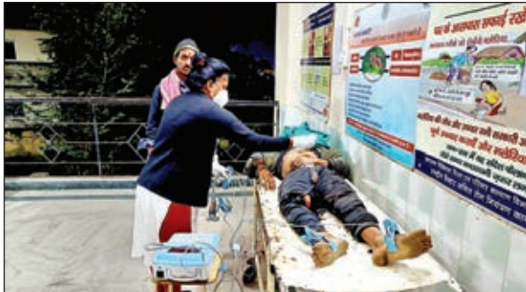
घायल बाइक सवार को ईसीजी करते स्वास्थ्य कर्मी