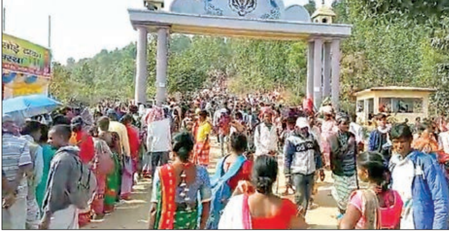
23वें अंतरराष्ट्रीय महासम्मेलन में शामिल देश-विदेश के सरना धर्मावलंबी।

बेरमो। मुख्यमंत्री हेमंत सोरेन सोमवार को लुगुबुरु घंटाबाड़ी धोरोगमाड़ा गोमिया के ललपनिया के कार्तिक पूर्णिमा के अवसर पर आयोजित 23वां अंतरराष्ट्रीय सरना धर्म महासम्मेलन 2023 में शामिल हुए। मुख्यमंत्री ने लुगुबुरु पहाड़ स्थित पुनाय थान में अपनी पत्नी कल्पना सोरेन के साथ पूजा अर्चना बोंगा बुरु कर राज्य की खुशहाली की कामना की। लुगुबुरु में चाई चंपा पार्क में लुगु बाबा और लुगु आबो की प्रतिमा का मुख्यमंत्री ने अनावरण किया। दो दिवसीय महासम्मेलन में देश-विदेश के लाखों सरना धर्मावलंबियों ने भाग लिया। मुख्यमंत्री ने हाइडल पावर प्लांट को लेकर कहा की मैं आश्चर्य करता हूँ जब तक मैं हूँ