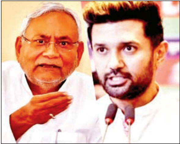
रविवार को चिराग पासवान ने कहा