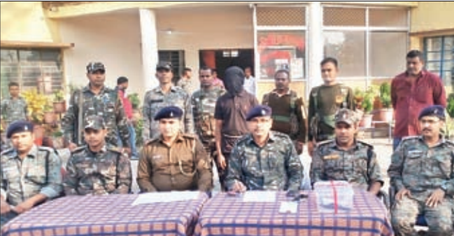
प्रेस वार्ता कर जानकारी देते एसडीपीओ।