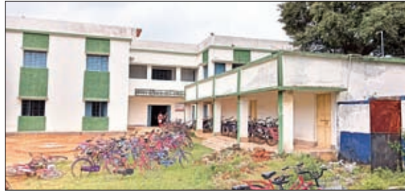
कन्या उच्च विद्यालय।