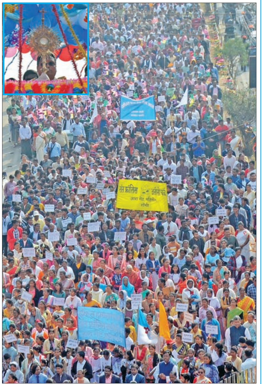
काथलिक विश्वासियों ने रविवार को क्राइस्ट को राजा घोषित करने के उद्देश्य से भव्य शोभायात्रा निकाली। शोभा यात्रा के पीछे मोमवती लिए बच्चे शामिल थे।