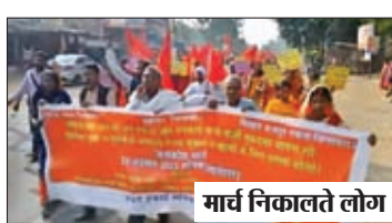
मार्च निकालते लोग।

लातेहार। जिला के मनिका प्रखण्ड में भाकपा माले के बैनर तले शनिवार को प्रतिवाद मार्च निकाला गया। प्रतिवाद मार्च में शामिल सैकड़ों की संख्या में महिला