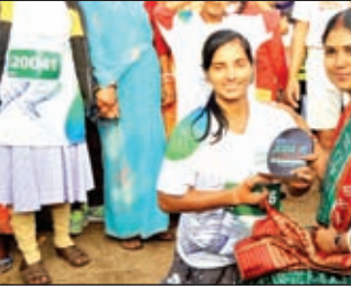
एक विकलांग धाविका के जुनून को देख पुरस्कृत करती अतिथि।