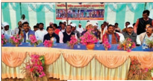
मौके पर मौजूद मंचासिन अतिथि।