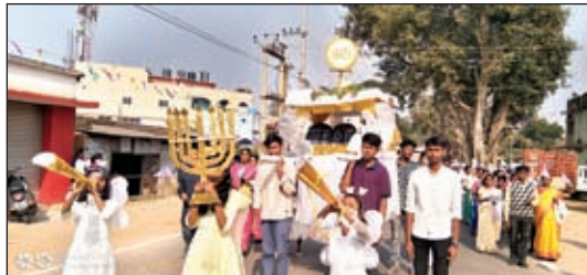
शोभायात्रा में झांकी लेकर चलते युवक।

विश्वासी लगाते रहे। शोभायात्रा में फादर सज्जे हुए वाहन में पवित्र संक्रामेंट के साथ चल रहे थे। संक्रामेंट वाले वाहन के आगे बच्चियां फुलों की वर्षा कर रही थी। शोभायात्रा में शामिल धर्म विश्वासी प्रभु ख्रीस्त का गुणगान करते हुए अपनी आस्था व भक्ति प्रगट की और कतार बढ़ तरीके से शोभायात्रा में प्रभु की महिमा पर गीत गाते चल रहे थे। तेरा वचन मेरे लिये प्रभु, ख्रीस्त राजा आओ आदि गीत विश्वासी गा रहे थे। ख्रीस्त राजा की शोभायात्रा में