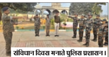
सविधान दिवस मनाते पुलिस प्रशासन।