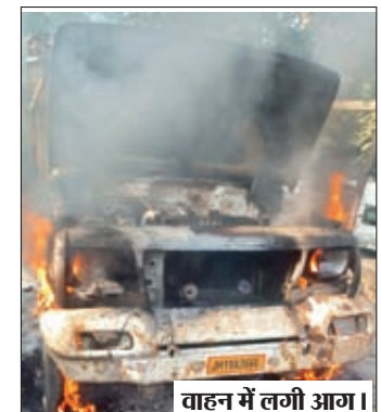
वाहन में लगी आग।

चंदवा। चंदवा थाना क्षेत्र अंतर्गत सुदूरवर्ती बरवाटोली के मड़मा गांव के समीप स्कूप माफियाओं के द्वारा चोरी का लोहा तार लोड वाहन को ले जाने से रोकने पर फायरिंग किये जाने के बाद आक्रोशित ग्रामीणों द्वारा स्कूप लोड पिकअप वाहन जेएच-19-ए-3686 को आग के हवाले कर दिये जाने का मामला सामने आया है। घटना की सूचना के