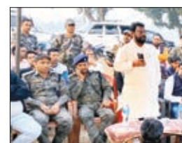
विधायक हाईवे ऑनर के साथ बैठक करते हुए।

बालुमाथ। लातेहार हाईवा ऑनर एसोसिएशन ने शनिवार को बालुमाथ हाई स्कूल के समीप तुवेद से कुसमाही चलने वाले