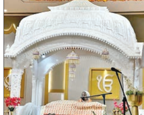
अखंड पाठ का दृश्य।

जमशेदपुर। 27 नवंबर को सिखों के प्रथम गुरु श्री गुरु नानक देव जी महाराज के 554वें प्रकाशपर्व की पावन बेला पर साकची गुरुद्वारा साहिब में अखंड पाठ आरंभ किये गए इससे पूर्व बीबीयों द्वारा आयोजित जपजी साहिब के लड़ीवार पाठ की समाप्ति भी की गयी। शनिवार को स्त्री सत्संग सभा सुखमणि साहिब कीर्तनी जत्थे की बीबीयों को सम्मानित भी किया गया। साकची की बीबियों द्वारा आयोजित लगातार पांच दिनों से चले आ रहे जपजी साहिब के लड़ीवार पाठ की समाप्ति संपन्न हुयी। समाप्ति के तुरंत बाद अखंड पाठ की आरम्भता की गयी जिसकी समाप्ति 27 नवंबर को सुबह 10:00