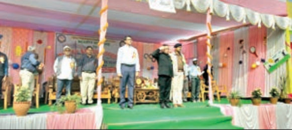
खेल का आयोजन करते छात्र, सलामी देते अतिथि एवं विजेता छात्र