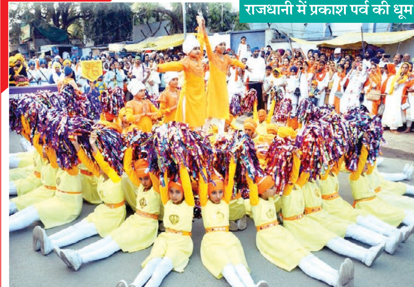
राजधानी में प्रकाश पर्व की धूम

रुपए से बनने वाले विद्यालय में अतिरिक्त वर्ग कक्ष, स्मार्ट क्लास, मॉडल आंगनवाड़ी केंद्र, पथ मरम्मत, विद्यालय में चहारदीवारी निर्माण, लिट्टीगुड़ा में डिग्री कॉलेज निर्माण योजनाओं का शिलान्यास किया। (शेष पेज 11 पर)