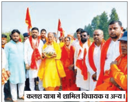
कलश यात्रा में शामिल विधायक व अन्य।