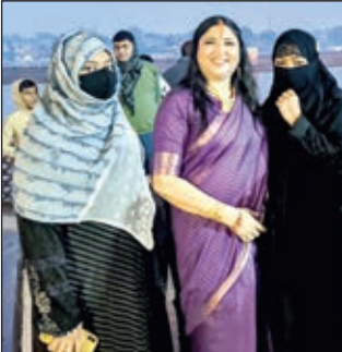
चेंबर द्वारा आयोजित मध्या रात्रि आरती के साथ समापन