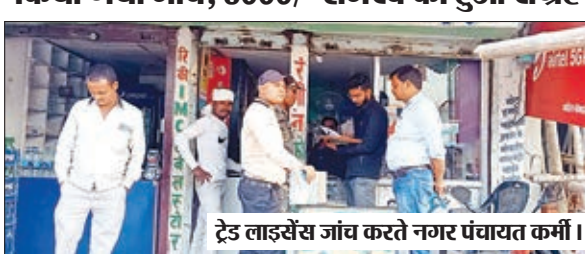
ट्रेड लाइसेंस जांच करते नगर पंचायत कर्मी।