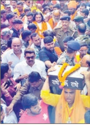
ऐतिहासिक रहा श्रीलक्ष्मीनारायण महायज्ञ सह मानवत कथा का कलश यात्रा

● राधे-राधे के जयकारा से गुंजायमान होता रहा शहर ● श्रद्धालुओं पर हेलीकॉप्टर से होती रही फूलों की बारिश ● जल यात्रा में शामिल होकर गदगद हुए श्रद्धालु