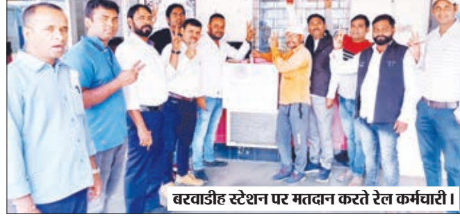
बरवाडीह स्टेशन पर मतदान करते रेल कर्मचारी।