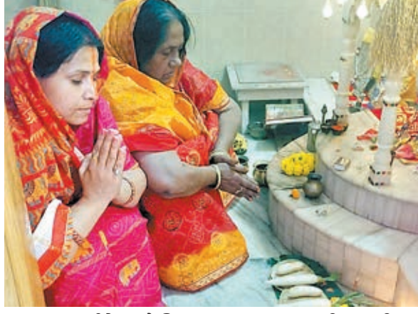
छठ महापर्व के दूसरे दिन खरना अनुष्ठान करतीं छठवती।

का 36 घंटे का निर्जला उपवास भी शुरू हो गया। आज अस्ताचलगामी सूर्य को और कल सुबह उदीयमान भागवान भास्कर को अर्घ्य अर्पित किया जायेगा। इधर राजधानी रांची में जगह जगह छठ बाजार सजे हैं। जिसमें सूप, टोकरी से लेकर मिट्टी के दीये, फल और सब्जियां मिल रहे हैं। राजधानी रांची की बात करें तो मुख्य बाजार जिला स्कूल, कचहरी, बकरी बाजार, बहुबाजार, चर्च रोड, रातु रोड, नामकुम, चुटिया, धुवां, शालीमार बाजार समेत अन्य इलाकों में लगा है।