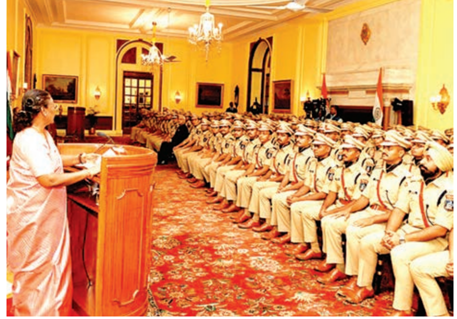
नयी दिल्ली में शनिवार को 2022 बैच के आइपीएस अधिकारियों को संबोधित करती राष्ट्रपति द्रौपदी मुर्मू।

भूमिका निभाता है। राष्ट्रपति ने कहा कि सरकार का लक्ष्य प्रत्येक नागरिक की प्रतिभा और क्षमता के विकास के लिए अवसर प्रदान करना है। यह हमारी राष्ट्रीय प्राथमिकता है कि सभी नागरिक विकास यात्रा में भागीदार बनें। उन्होंने कहा कि अमृतकाल के दौरान देश को समग्र रूप से विकसित राष्ट्र बनाने के संकल्प को पूरा करने में पुलिस अधिकारियों की भी निर्णायक भूमिका रहेगी। उन्होंने कहा कि 2022 के इस बैच में 21 प्रतिशत महिलाएं हैं। आईपीएस में 554 महिला अधिकारी कार्यरत हैं जो कि तैनात अधिकारियों की कुल संख्या 4344 का लगभग 13 प्रतिशत है। राष्ट्रपति ने विश्वास व्यक्त करते हुए कहा कि महिला आईपीएस की संख्या में और वृद्धि होती रहेगी।