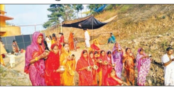
घाट पर छठ व्रती।