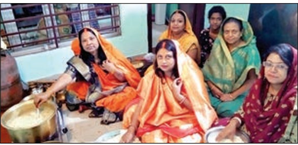
विजया गार्डेन वारीडीह में खरना प्रसाद वनाती व्रती महिलाएं।

खबर मन्त्रा व्यूटे जमशेदपुर। छठ महापर्व को लेकर लौहनगरी जमशेदपुर में गजब का उत्साह नजर आ रहा है। लोग अपने-अपने तरीके से छठ महापर्व में सहयोग कर पुण्य के भागी बन रहे हैं। आज छठ व्रतियों ने खरना प्रसाद ग्रहण किया और इसके साथ निर्रजला उपवास शुरु हो गया। रविवार 19 नवंबर की शाम व्रती अस्तांचलगामी सूर्य को अर्घ्य अर्पित करेंगे जबकि 20 नवंबर की सुबह उगते सूर्य को अर्घ्य दिया जायेगा। शहर के स्थिनिष्ठ छठ घाटों पर प्रशासन ने स्थानीय स्वयंसेवी संगठनों के सहयोग से घाटों की स्वच्छता एवं सुरक्षा व्यवस्था समेत अन्य इंतजामात को अंतिम रूप दे दिया। इस बीच, साकची,मानगो, वारीडीह, बिरसानगर,गोलपुरी समेत अन्य बाजारों में छठ पूजन सामग्रीयों में व्रती और उनके परिजन दिन भर खरीददारी करते रहे। केले का घवघ,फल,गागल, नारियल, गाजर, सिंधारा, हल्दी