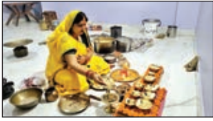
खरना पूजा करती पूर्व शिक्षा मंत्री सह कोडरमा विधायक।

कोडरमा। लोक आस्था और शुद्धता का प्रतीक चार दिवसीय छठ महापर्व के दूसरे दिन शनिवार को पूरी श्रद्धा और भक्ति कर साथ खरना संपन्न हुआ। छठव्रतियों ने दिन भर निर्जला उपवास कर, शाम को पूजा अर्चना के बाद खरना का प्रसाद ग्रहण किये, इसके साथ ही व्रतियों का 36 घण्टे का निर्जला उपवास शुरू हो गया, रविवार के जिले के विभिन्न छठ घाटों में अस्ताचलगामी भगवान भास्कर को