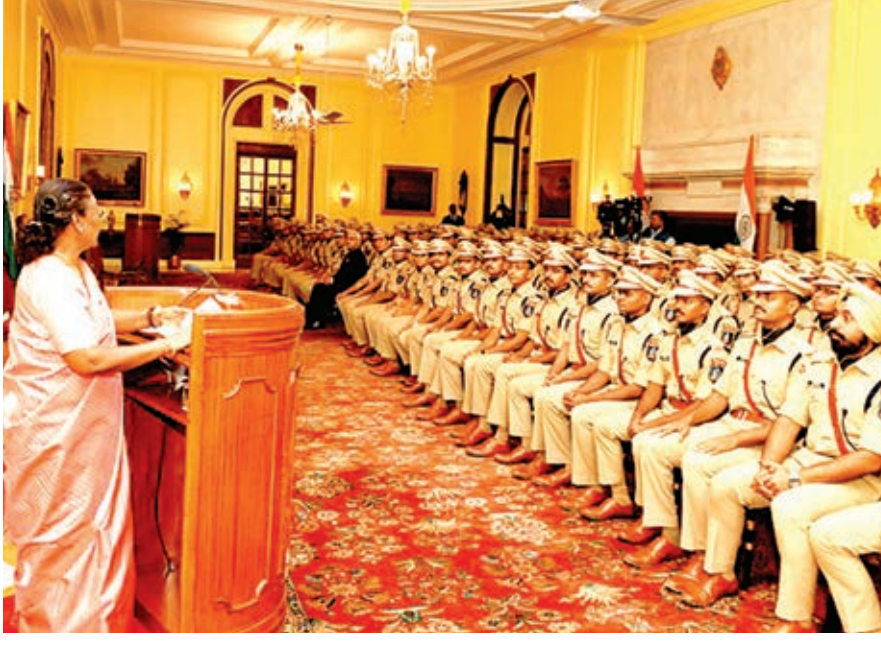
नयी दिल्ली में शनिवार को 2022 बैच के आइपीएस अधिकारियों को संबोधित करतीं राष्ट्रपति द्रौपदी मुर्मू।

भूमिका नभालता है। राष्ट्रपति ने कहा कि सरकार का लक्ष्य प्रत्येक नागरिक की प्रतिभा और क्षमता के विकास के लिए अवसर प्रदान करना है। यह हमारी राष्ट्रीय प्राथमिकता है कि सभी नागरिक विकास यात्रा में भागीदार बनें। उन्होंने कहा कि अमृतकाल के दौरान देश को समग्र रूप से विकसित राष्ट्र बनाने के संकल्प को पूरा करने में पुलिस अधिकारियों की भी निर्यायक भूमिका रहेगी। उन्होंने कहा कि 2022 के इस बैच में 21 प्रतिशत महिलाएं हैं। आईपीएस में 554 महिला अधिकारी कार्यरत हैं जो कि तैनात अधिकारियों की कुल संख्या 4344 का लगभग 13 प्रतिशत है। राष्ट्रपति ने विश्वास व्यक्त करते हुए कहा कि महिला आईपीएस की संख्या में और वृद्धि होती रहेगी।