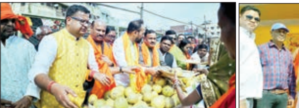
बाबा बैद्यनाथ सेवा संघ ने हजारों छठ व्रतधारियों के बीच किया निःशुल्क फल और प्रसाद का वितरण