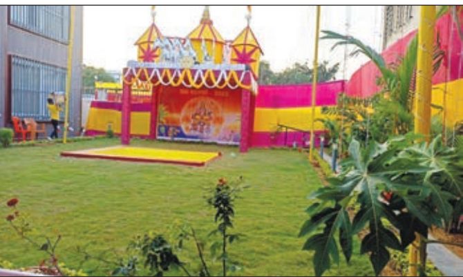
छठ घाट में तब्दील मंत्री मिथिलेश टाकुर का आवास।