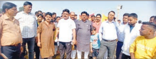
छठ घाटों का निरीक्षण करते मंत्री व अन्य।

घाट को आकर्षक तरीके से सजाया गया है। मंत्री श्री टाकुर ने कहा कि आने वाले दिनों में छठ व्रतियों को किसी तरह की परेशानी नहीं हो उसके लिए नदी को साफ सुथरा रखने की दिशा में जल्द ही कार्य किया जाएगा। उन्होंने सभी अधिकारी को छठ घाटों पर बेहतर सुविधा बेहतर सुरक्षा व्यवस्था मुहैया करने का निर्देश दिया।