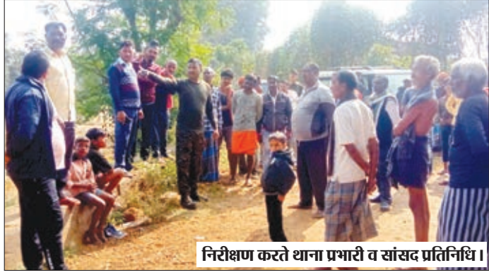
करने की बात कही ताकि किसी सूचनाओं का आदान-प्रदान किया जा सके। थाना प्रभारी ने कहा कि छठ पूजा पर विधि व्यवस्था संभारण को लेकर पुलिस बल