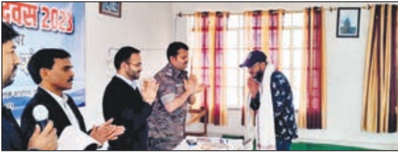
पत्रकार को सम्मानित करते डीसी-एसपी।